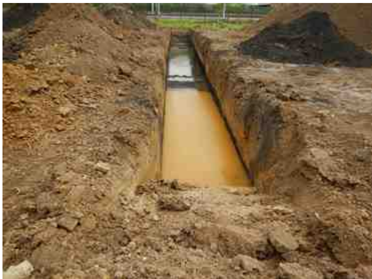
DSCN5125.JPG - Spoornummer(s): / - Inventarisnummer(s): / - Structuur: / - Zone/Werkput/Kijkvenster/Vlak: /6//