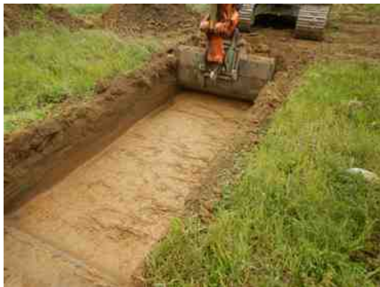
DSCN5078.JPG - Spoornummer(s): / - Inventarisnummer(s): / - Structuur: / - Zone/Werkput/Kijkvenster/Vlak: /4//