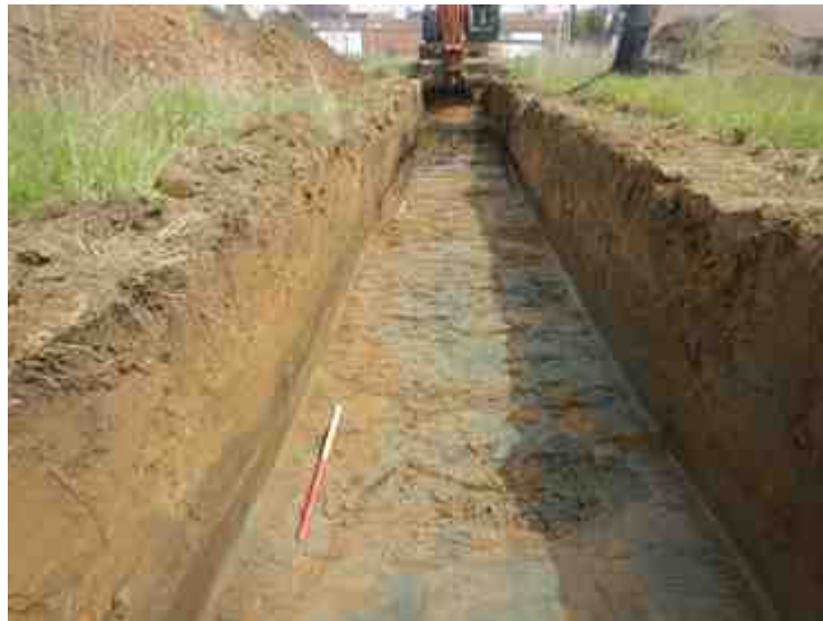
DSCN8868.JPG - Spoornummer(s): / - Inventarisnummer(s): / - Structuur: / - Zone/Werkput/Kijkvenster/Vlak: /2//