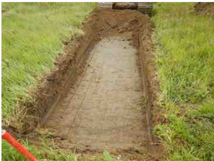
DSCN5133.JPG - Spoornummer(s): / - Inventarisnummer(s): / - Structuur: / - Zone/Werkput/Kijkvenster/Vlak: /3//