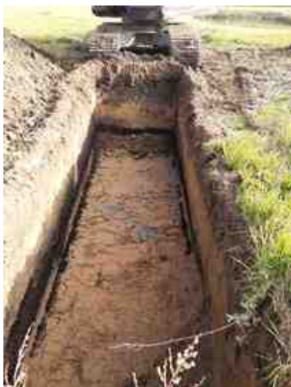
IMG_20210503_084524805.jpg - Spoornummer(s): / - Inventarisnummer(s): / - Structuur: / - Zone/Werkput/Kijkvenster/Vlak: /1//