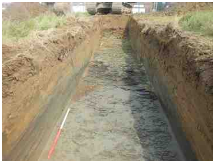
DSCN8878.JPG - Spoornummer(s): / - Inventarisnummer(s): / - Structuur: / - Zone/Werkput/Kijkvenster/Vlak: /2//