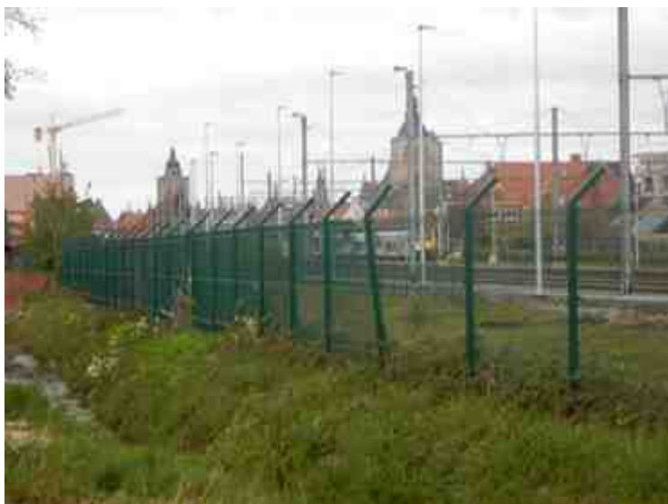
DSCN5130.JPG - Spoornummer(s): / - Inventarisnummer(s): / - Structuur: Sfeer 1 - Zone/Werkput/Kijkvenster/Vlak: ///