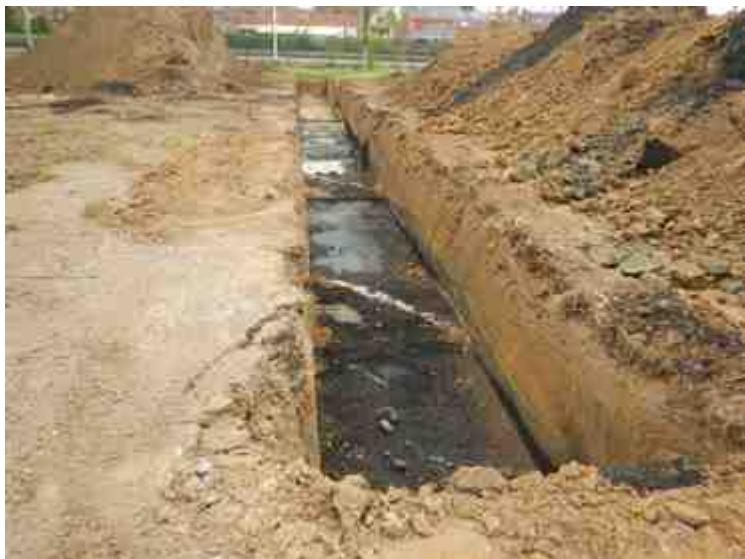
DSCN5124.JPG - Spoornummer(s): / - Inventarisnummer(s): / - Structuur: / - Zone/Werkput/Kijkvenster/Vlak: /5//