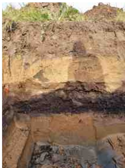
IMG_20210503_085503380_HDR.jpg - Spoornummer(s): / - Inventarisnummer(s): / - Structuur: Profiel 1 - Zone/Werkput/Kijkvenster/Vlak: /