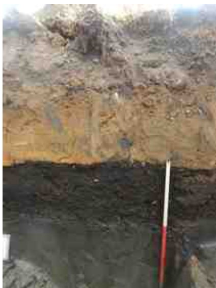
DSCN8847.JPG - Spoornummer(s): / - Inventarisnummer(s): / - Structuur: Profiel 2 - Zone/Werkput/Kijkvenster/Vlak: /