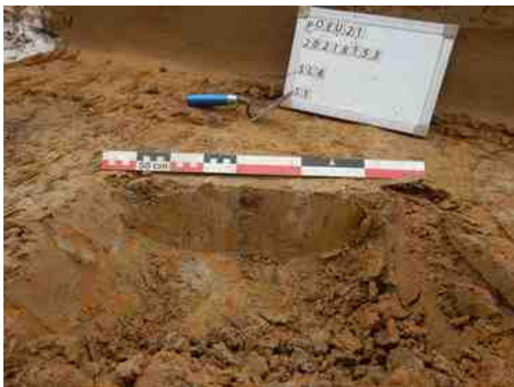
DSCN5093.JPG - Spoornummer(s): 1 - Inventarisnummer(s): / - Structuur: / - Zone/Werkput/Kijkvenster/Vlak: /