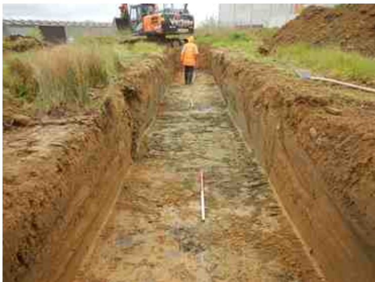
DSCN5103.JPG - Spoornummer(s): / - Inventarisnummer(s): / - Structuur: / - Zone/Werkput/Kijkvenster/Vlak: /4//