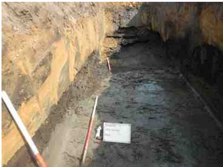
DSCN8852.JPG - Spoornummer(s): / - Inventarisnummer(s): / - Structuur: / - Zone/Werkput/Kijkvenster/Vlak: /2//