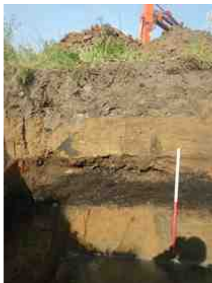
DSCN8834.JPG - Spoornummer(s): / - Inventarisnummer(s): / - Structuur: Profiel 1 - Zone/Werkput/Kijkvenster/Vlak: /