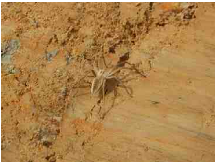
DSCN8873.JPG - Spoornummer(s): / - Inventarisnummer(s): / - Structuur: Sfeer 1 - Zone/Werkput/Kijkvenster/Vlak: /