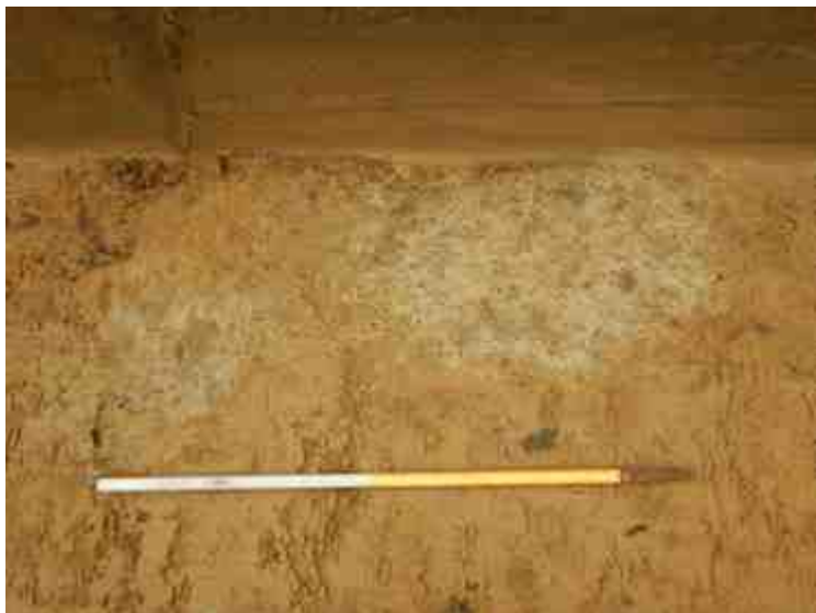
DSCN5089.JPG - Spoornummer(s): 1, 2 - Inventarisnummer(s): / - Structuur: / - Zone/Werkput/Kijkvenster/Vlak: /