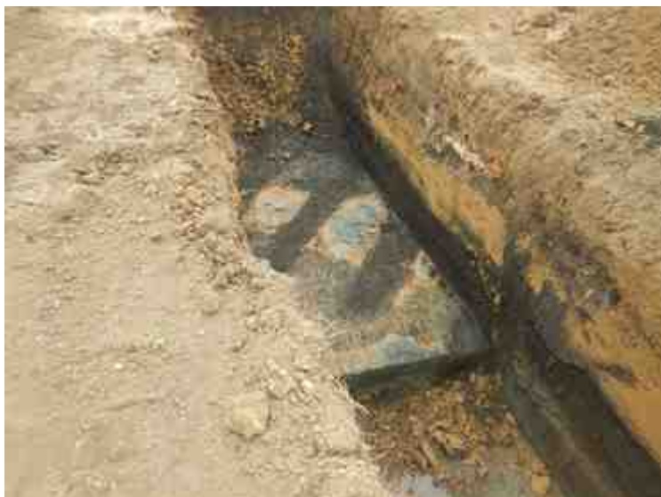
DSCN8911.JPG - Spoornummer(s): / - Inventarisnummer(s): / - Structuur: / - Zone/Werkput/Kijkvenster/Vlak: /6//