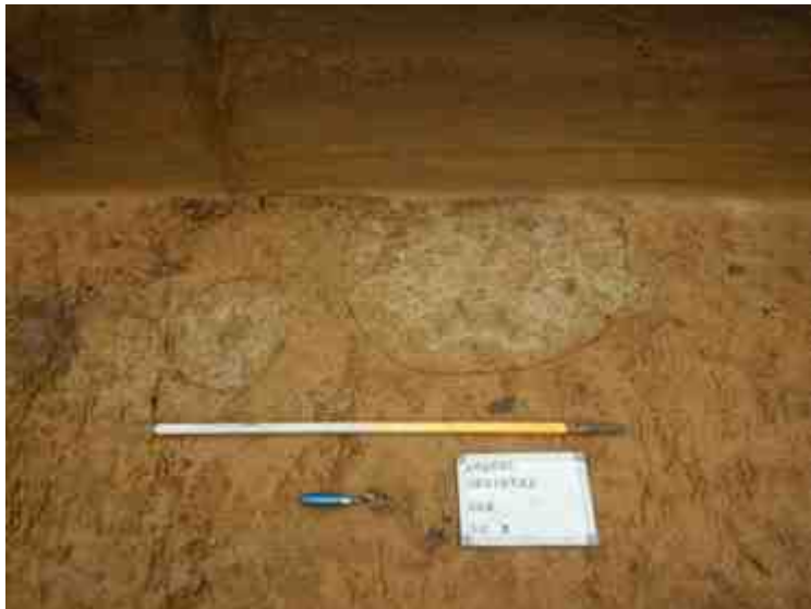
DSCN5091.JPG - Spoornummer(s): 1, 2 - Inventarisnummer(s): / - Structuur: / - Zone/Werkput/Kijkvenster/Vlak: /