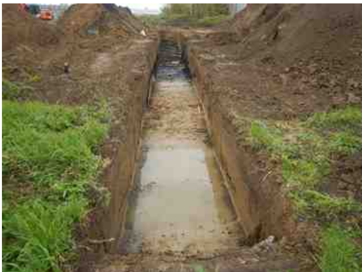
DSCN5065.JPG - Spoornummer(s): / - Inventarisnummer(s): / - Structuur: / - Zone/Werkput/Kijkvenster/Vlak: /5//