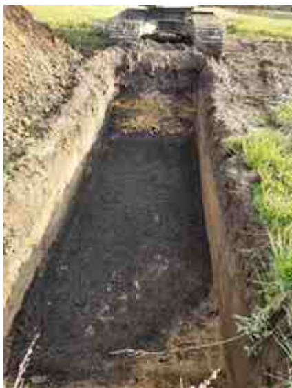
IMG_20210503_084310902_HDR.jpg - Spoornummer(s): / - Inventarisnummer(s): / - Structuur: / - Zone/Werkput/Kijkvenster/Vlak: /1//