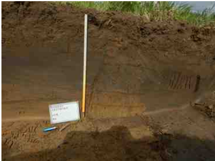
DSCN5140.JPG - Spoornummer(s): / - Inventarisnummer(s): / - Structuur: Profiel 6 - Zone/Werkput/Kijkvenster/Vlak: /