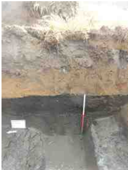
DSCN8845.JPG - Spoornummer(s): / - Inventarisnummer(s): / - Structuur: Profiel 2 - Zone/Werkput/Kijkvenster/Vlak: /