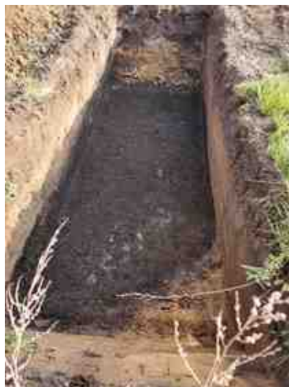
IMG_20210503_084308891_HDR.jpg - Spoornummer(s): / - Inventarisnummer(s): / - Structuur: / - Zone/Werkput/Kijkvenster/Vlak: /1//