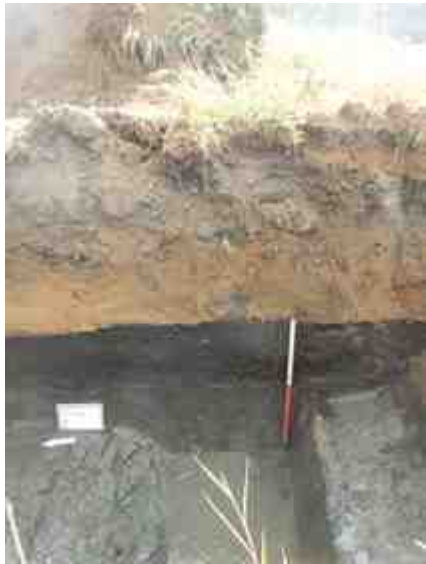
DSCN8843.JPG - Spoornummer(s): / - Inventarisnummer(s): / - Structuur: Profiel 2 - Zone/Werkput/Kijkvenster/Vlak: /