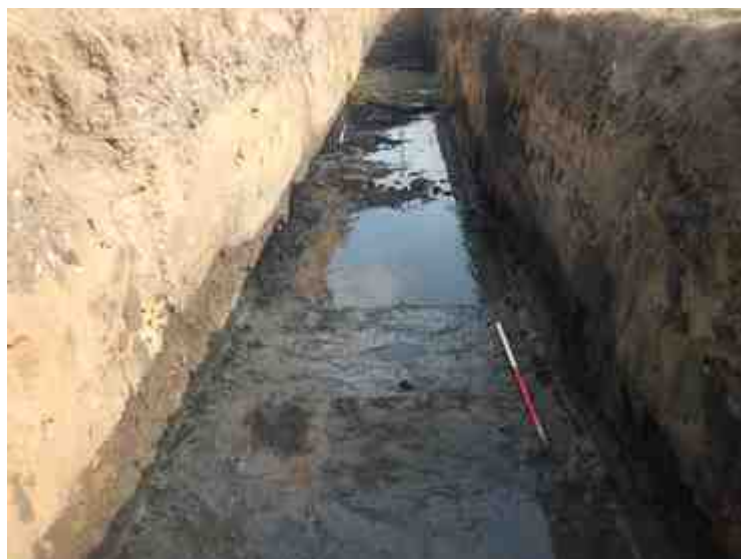
DSCN8828.JPG - Spoornummer(s): / - Inventarisnummer(s): / - Structuur: / - Zone/Werkput/Kijkvenster/Vlak: /1//