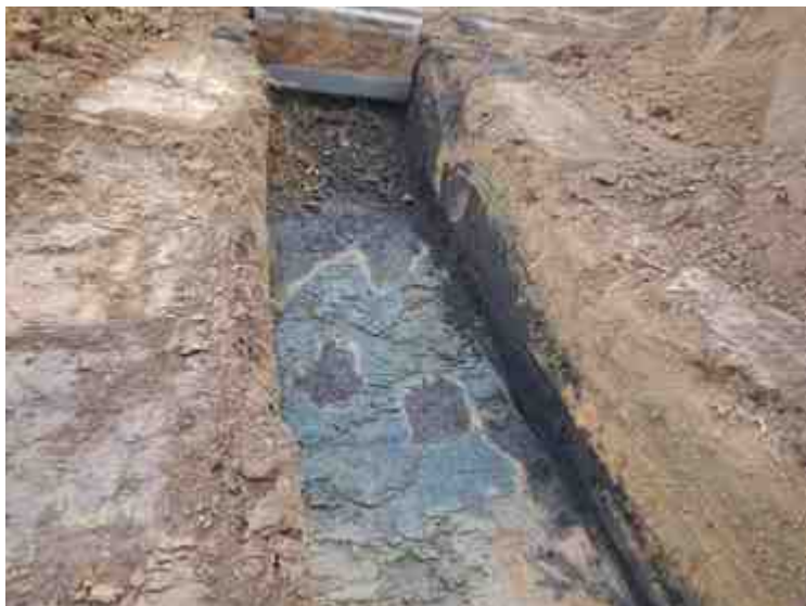
DSCN5061.JPG - Spoornummer(s): / - Inventarisnummer(s): / - Structuur: / - Zone/Werkput/Kijkvenster/Vlak: /5//