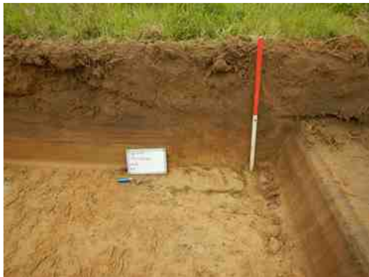
DSCN5080.JPG - Spoornummer(s): / - Inventarisnummer(s): / - Structuur: Profiel 5 - Zone/Werkput/Kijkvenster/Vlak: /