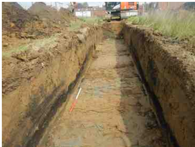
DSCN8874.JPG - Spoornummer(s): / - Inventarisnummer(s): / - Structuur: / - Zone/Werkput/Kijkvenster/Vlak: /2//