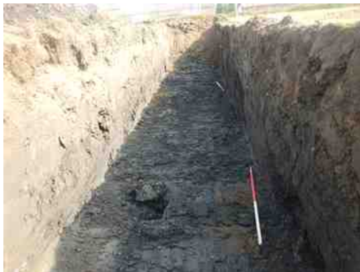
DSCN8832.JPG - Spoornummer(s): / - Inventarisnummer(s): / - Structuur: / - Zone/Werkput/Kijkvenster/Vlak: /1//