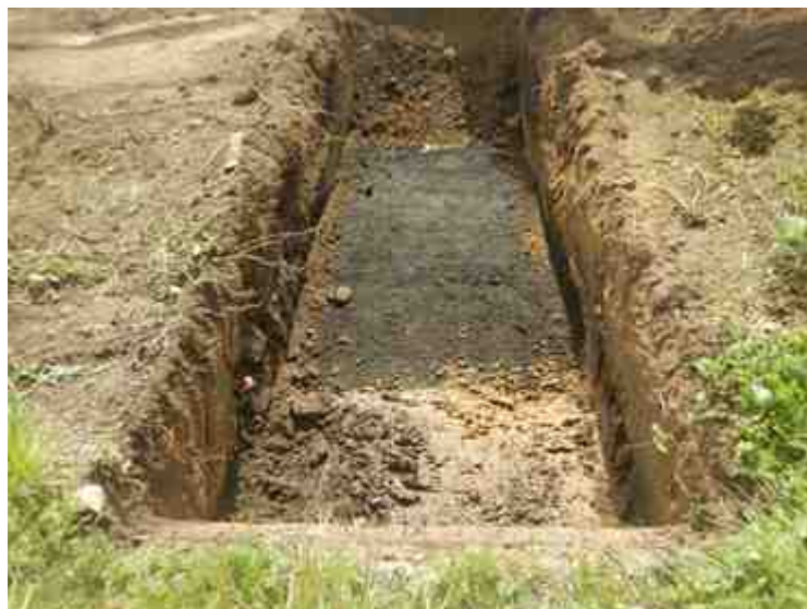
DSCN8892.JPG - Spoornummer(s): / - Inventarisnummer(s): / - Structuur: / - Zone/Werkput/Kijkvenster/Vlak: /6//