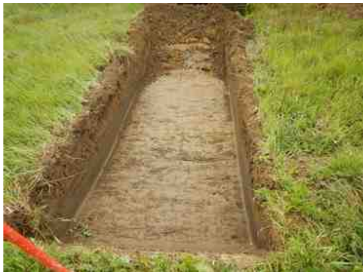
DSCN5135.JPG - Spoornummer(s): / - Inventarisnummer(s): / - Structuur: / - Zone/Werkput/Kijkvenster/Vlak: /3//