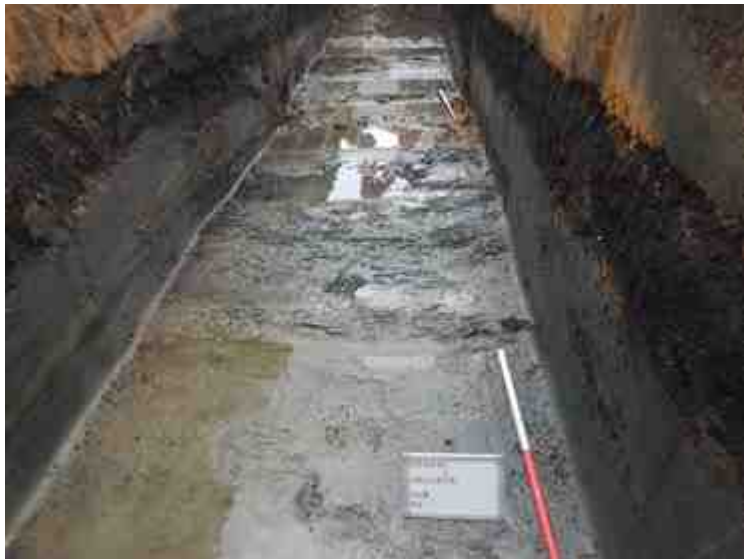
DSCN8917.JPG - Spoornummer(s): / - Inventarisnummer(s): / - Structuur: / - Zone/Werkput/Kijkvenster/Vlak: /6//