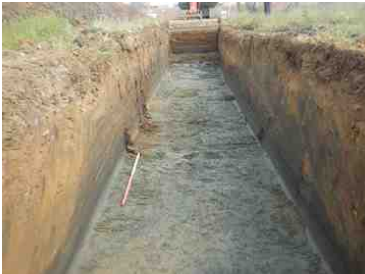
DSCN8863.JPG - Spoornummer(s): / - Inventarisnummer(s): / - Structuur: / - Zone/Werkput/Kijkvenster/Vlak: /2//