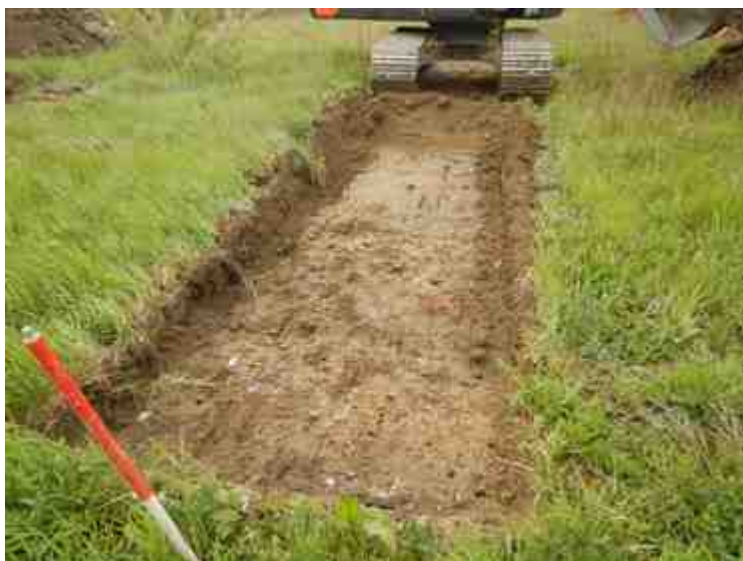
DSCN5131.JPG - Spoornummer(s): / - Inventarisnummer(s): / - Structuur: / - Zone/Werkput/Kijkvenster/Vlak: /3//