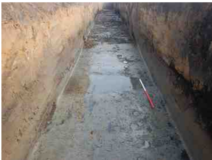
DSCN8825.JPG - Spoornummer(s): / - Inventarisnummer(s): / - Structuur: / - Zone/Werkput/Kijkvenster/Vlak: /1//