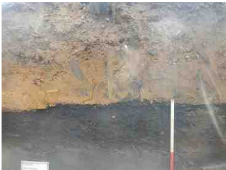
DSCN8849.JPG - Spoornummer(s): / - Inventarisnummer(s): / - Structuur: Profiel 2 - Zone/Werkput/Kijkvenster/Vlak: /