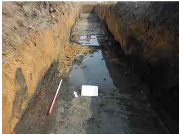
DSCN8860.JPG - Spoornummer(s): / - Inventarisnummer(s): / - Structuur: / - Zone/Werkput/Kijkvenster/Vlak: /2//