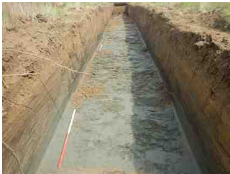
DSCN8866.JPG - Spoornummer(s): / - Inventarisnummer(s): / - Structuur: / - Zone/Werkput/Kijkvenster/Vlak: /2//