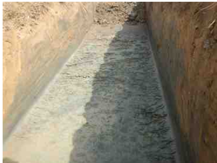
DSCN8858.JPG - Spoornummer(s): / - Inventarisnummer(s): / - Structuur: / - Zone/Werkput/Kijkvenster/Vlak: /2//