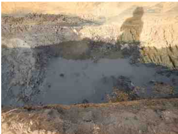
DSCN8856.JPG - Spoornummer(s): / - Inventarisnummer(s): / - Structuur: / - Zone/Werkput/Kijkvenster/Vlak: /2//