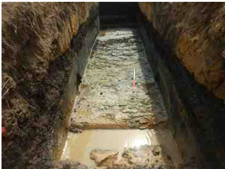
DSCN8903.JPG - Spoornummer(s): / - Inventarisnummer(s): / - Structuur: / - Zone/Werkput/Kijkvenster/Vlak: /6//