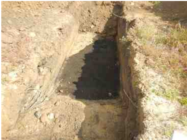
DSCN8839.JPG - Spoornummer(s): / - Inventarisnummer(s): / - Structuur: / - Zone/Werkput/Kijkvenster/Vlak: /2//