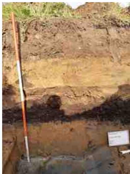
IMG_20210503_085825920_HDR.jpg - Spoornummer(s): / - Inventarisnummer(s): / - Structuur: Profiel 1 - Zone/Werkput/Kijkvenster/Vlak: /