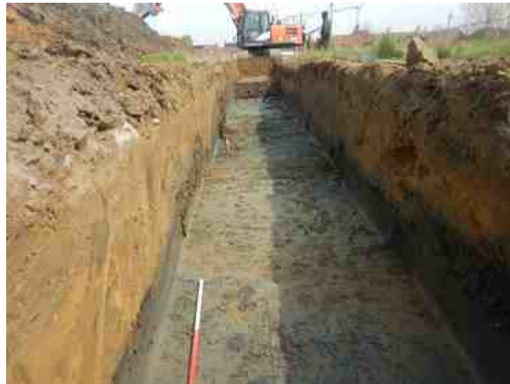
DSCN8862.JPG - Spoornummer(s): / - Inventarisnummer(s): / - Structuur: / - Zone/Werkput/Kijkvenster/Vlak: /2//