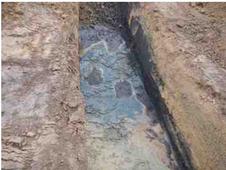
DSCN5060.JPG - Spoornummer(s): / - Inventarisnummer(s): / - Structuur: / - Zone/Werkput/Kijkvenster/Vlak: /5//