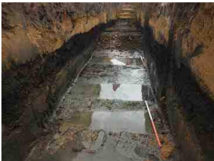
DSCN8918.JPG - Spoornummer(s): / - Inventarisnummer(s): / - Structuur: / - Zone/Werkput/Kijkvenster/Vlak: /6//