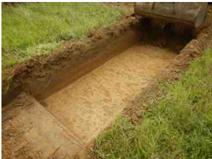
DSCN5079.JPG - Spoornummer(s): / - Inventarisnummer(s): / - Structuur: / - Zone/Werkput/Kijkvenster/Vlak: /4//