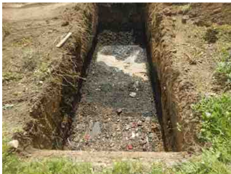
DSCN8894.JPG - Spoornummer(s): / - Inventarisnummer(s): / - Structuur: / - Zone/Werkput/Kijkvenster/Vlak: /6//