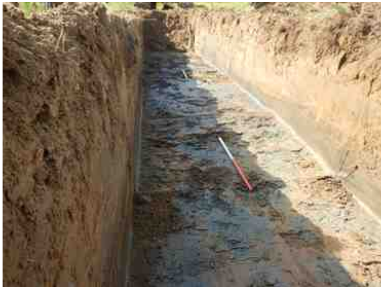
DSCN5153.JPG - Spoornummer(s): / - Inventarisnummer(s): / - Structuur: / - Zone/Werkput/Kijkvenster/Vlak: /3//