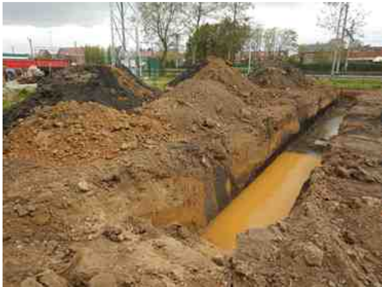
DSCN5126.JPG - Spoornummer(s): / - Inventarisnummer(s): / - Structuur: / - Zone/Werkput/Kijkvenster/Vlak: /6//