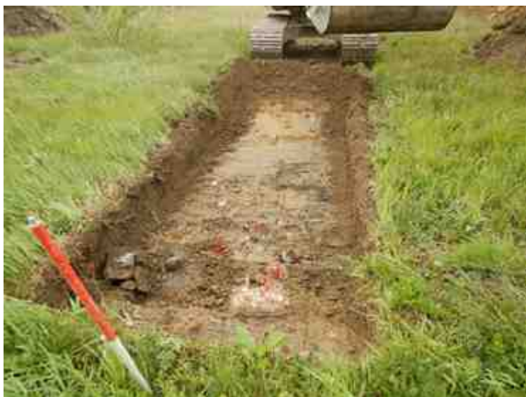
DSCN5132.JPG - Spoornummer(s): / - Inventarisnummer(s): / - Structuur: / - Zone/Werkput/Kijkvenster/Vlak: /3//