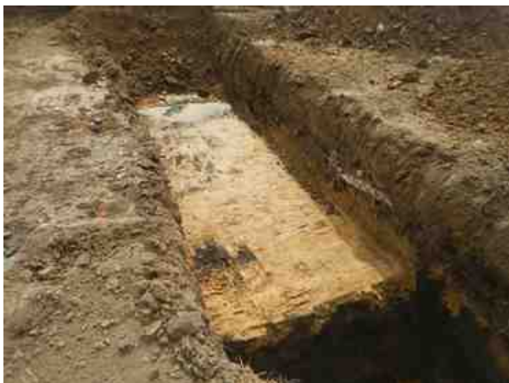
DSCN8907.JPG - Spoornummer(s): / - Inventarisnummer(s): / - Structuur: / - Zone/Werkput/Kijkvenster/Vlak: /6//