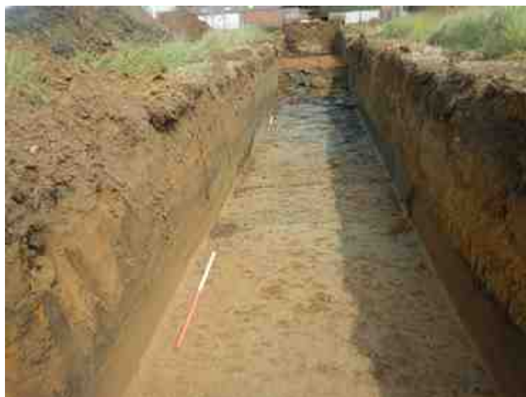
DSCN8876.JPG - Spoornummer(s): / - Inventarisnummer(s): / - Structuur: / - Zone/Werkput/Kijkvenster/Vlak: /2//