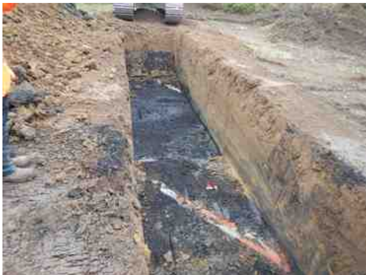
DSCN5063.JPG - Spoornummer(s): / - Inventarisnummer(s): / - Structuur: / - Zone/Werkput/Kijkvenster/Vlak: /5//