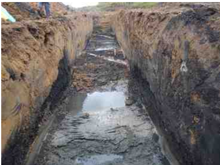
DSCN5071.JPG - Spoornummer(s): / - Inventarisnummer(s): / - Structuur: / - Zone/Werkput/Kijkvenster/Vlak: /5//