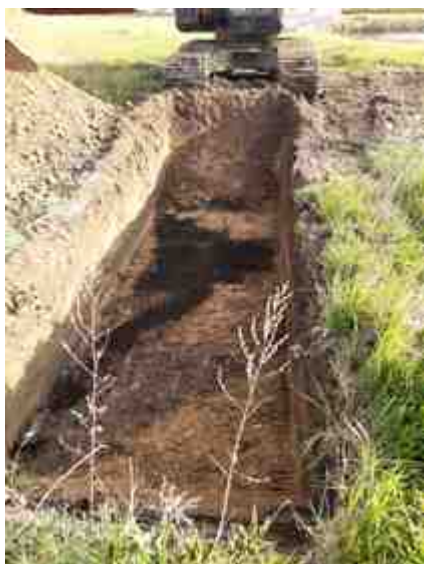
IMG_20210503_084120655.jpg - Spoornummer(s): / - Inventarisnummer(s): / - Structuur: / - Zone/Werkput/Kijkvenster/Vlak: /1//