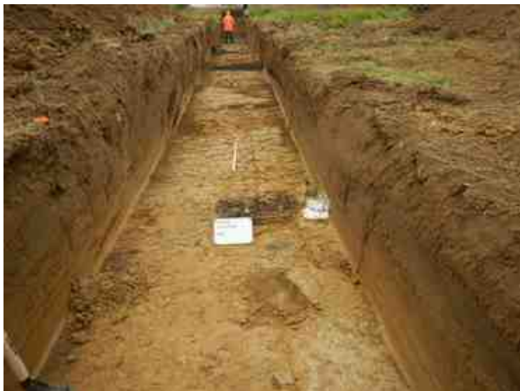
DSCN5095.JPG - Spoornummer(s): / - Inventarisnummer(s): / - Structuur: / - Zone/Werkput/Kijkvenster/Vlak: /4//