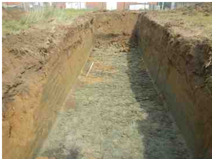
DSCN8880.JPG - Spoornummer(s): / - Inventarisnummer(s): / - Structuur: / - Zone/Werkput/Kijkvenster/Vlak: /2//