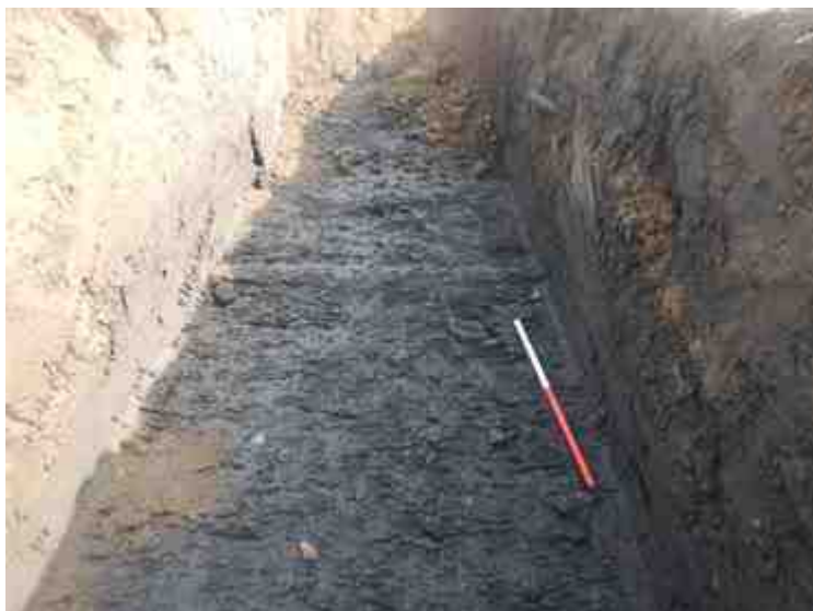
DSCN8833.JPG - Spoornummer(s): / - Inventarisnummer(s): / - Structuur: / - Zone/Werkput/Kijkvenster/Vlak: /1//