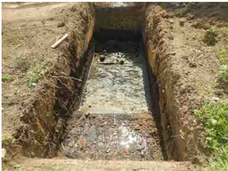
DSCN8897.JPG - Spoornummer(s): / - Inventarisnummer(s): / - Structuur: / - Zone/Werkput/Kijkvenster/Vlak: /6//