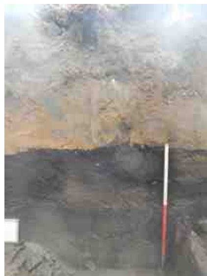
DSCN8846.JPG - Spoornummer(s): / - Inventarisnummer(s): / - Structuur: Profiel 2 - Zone/Werkput/Kijkvenster/Vlak: /