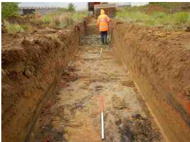
DSCN5101.JPG - Spoornummer(s): / - Inventarisnummer(s): / - Structuur: / - Zone/Werkput/Kijkvenster/Vlak: /4//