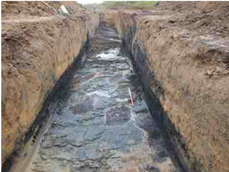
DSCN5069.JPG - Spoornummer(s): / - Inventarisnummer(s): / - Structuur: / - Zone/Werkput/Kijkvenster/Vlak: /5//