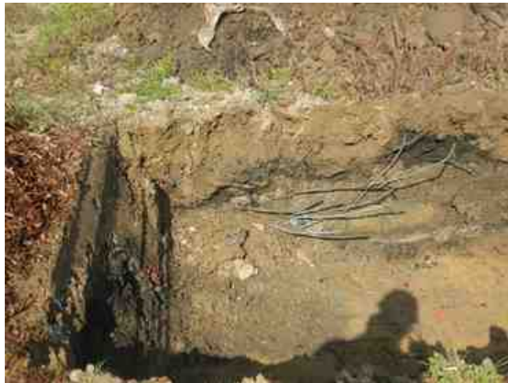
DSCN8838.JPG - Spoornummer(s): / - Inventarisnummer(s): / - Structuur: / - Zone/Werkput/Kijkvenster/Vlak: /2//