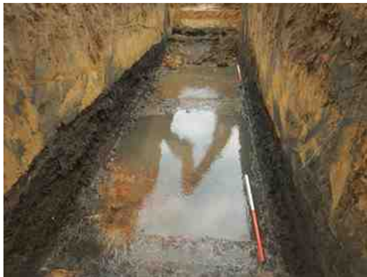
DSCN8924.JPG - Spoornummer(s): / - Inventarisnummer(s): / - Structuur: / - Zone/Werkput/Kijkvenster/Vlak: /6//