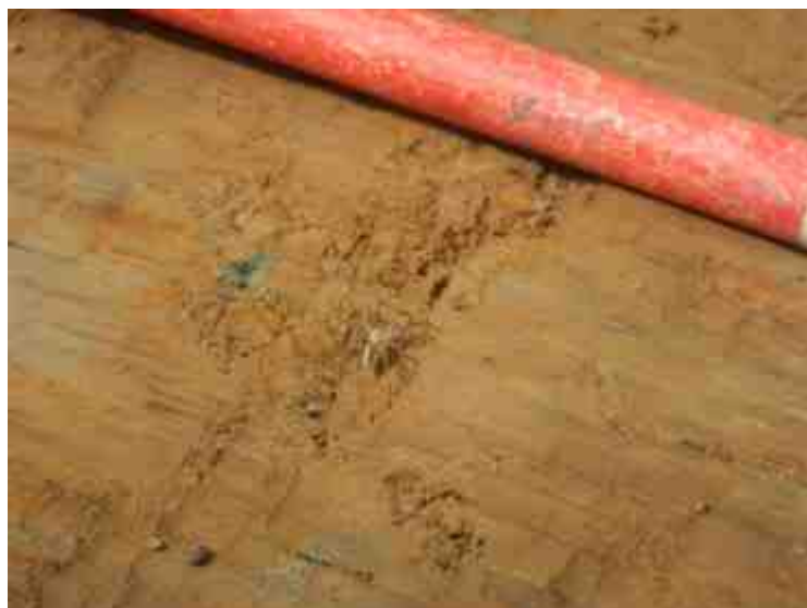
DSCN8872.JPG - Spoornummer(s): / - Inventarisnummer(s): / - Structuur: Sfeer 1 - Zone/Werkput/Kijkvenster/Vlak: /