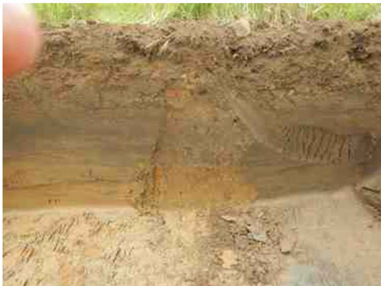
DSCN5136.JPG - Spoornummer(s): / - Inventarisnummer(s): / - Structuur: / - Zone/Werkput/Kijkvenster/Vlak: /6//