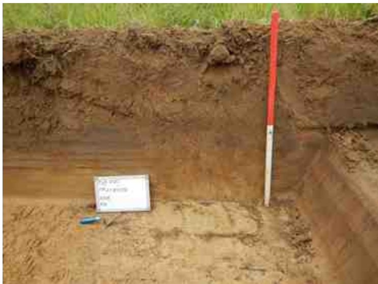
DSCN5081.JPG - Spoornummer(s): / - Inventarisnummer(s): / - Structuur: Profiel 5 - Zone/Werkput/Kijkvenster/Vlak: /