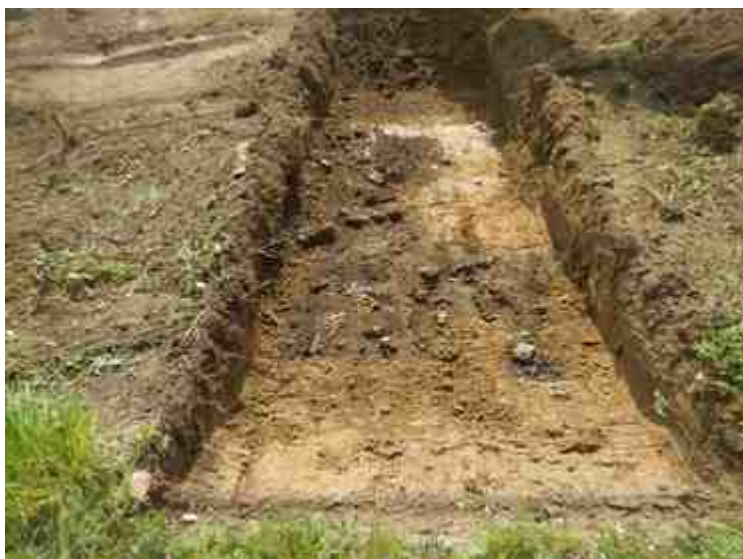
DSCN8891.JPG - Spoornummer(s): / - Inventarisnummer(s): / - Structuur: / - Zone/Werkput/Kijkvenster/Vlak: /6//