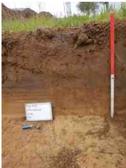
DSCN5083.JPG - Spoornummer(s): / - Inventarisnummer(s): / - Structuur: Profiel 5 - Zone/Werkput/Kijkvenster/Vlak: /