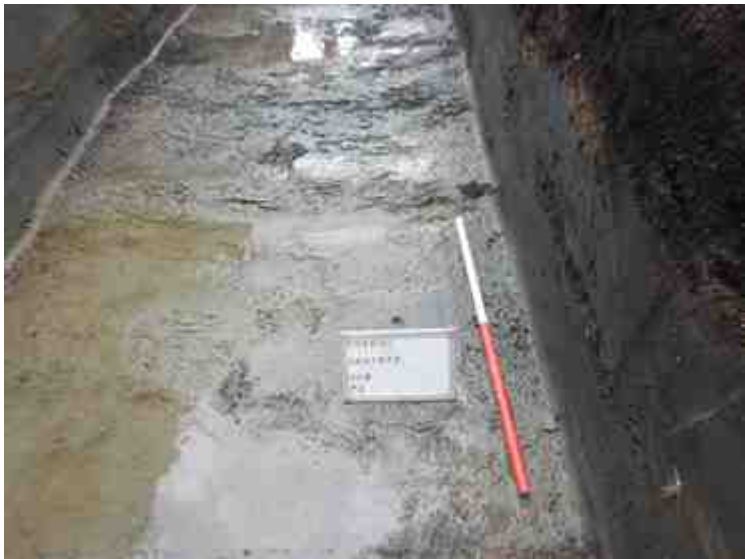
DSCN8916.JPG - Spoornummer(s): / - Inventarisnummer(s): / - Structuur: / - Zone/Werkput/Kijkvenster/Vlak: /6//