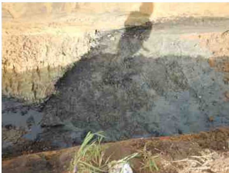
DSCN8857.JPG - Spoornummer(s): / - Inventarisnummer(s): / - Structuur: / - Zone/Werkput/Kijkvenster/Vlak: /2//