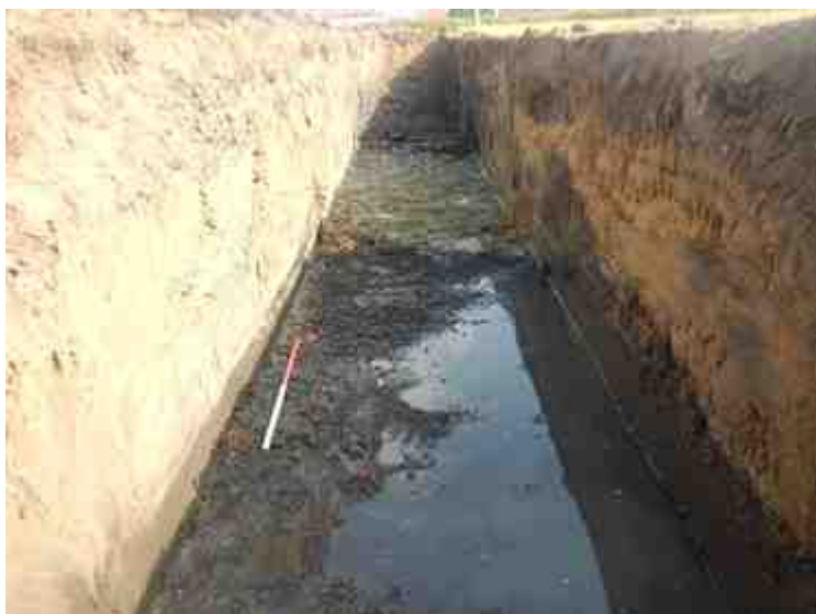
DSCN8829.JPG - Spoornummer(s): / - Inventarisnummer(s): / - Structuur: / - Zone/Werkput/Kijkvenster/Vlak: /1//