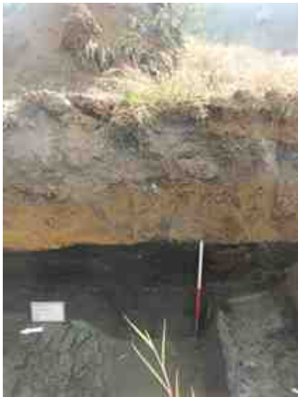
DSCN8844.JPG - Spoornummer(s): / - Inventarisnummer(s): / - Structuur: Profiel 2 - Zone/Werkput/Kijkvenster/Vlak: /