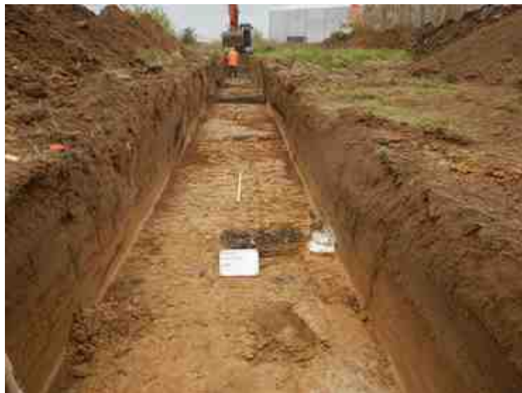
DSCN5094.JPG - Spoornummer(s): / - Inventarisnummer(s): / - Structuur: / - Zone/Werkput/Kijkvenster/Vlak: /4//