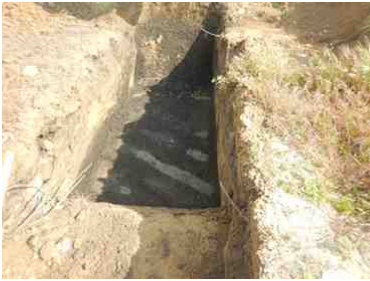
DSCN8840.JPG - Spoornummer(s): / - Inventarisnummer(s): / - Structuur: / - Zone/Werkput/Kijkvenster/Vlak: /2//