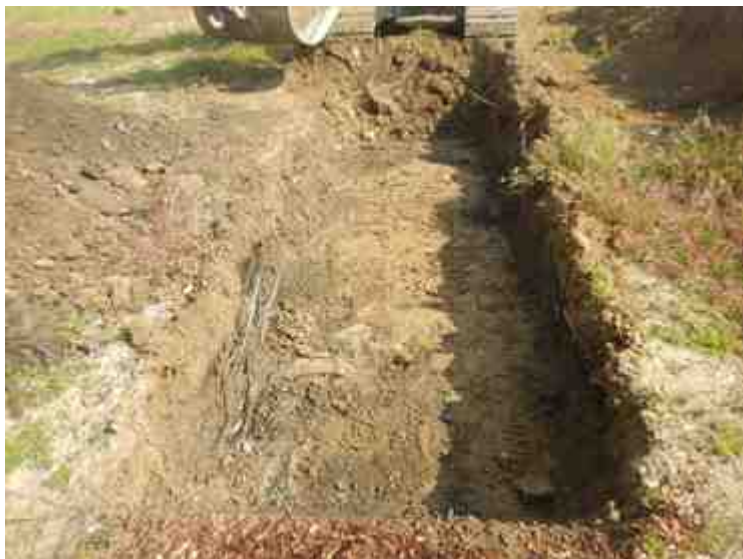
DSCN8837.JPG - Spoornummer(s): / - Inventarisnummer(s): / - Structuur: / - Zone/Werkput/Kijkvenster/Vlak: /2//