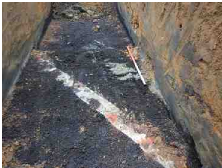
DSCN5073.JPG - Spoornummer(s): / - Inventarisnummer(s): / - Structuur: / - Zone/Werkput/Kijkvenster/Vlak: /5//