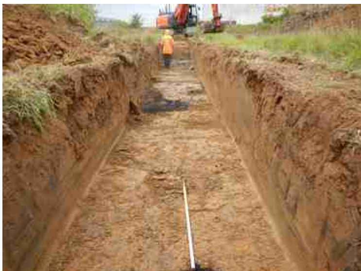
DSCN5099.JPG - Spoornummer(s): / - Inventarisnummer(s): / - Structuur: / - Zone/Werkput/Kijkvenster/Vlak: /4//