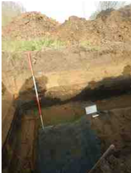
DSCN8821.JPG - Spoornummer(s): / - Inventarisnummer(s): / - Structuur: / Profiel 1 - Zone/Werkput/Kijkvenster/Vlak: /