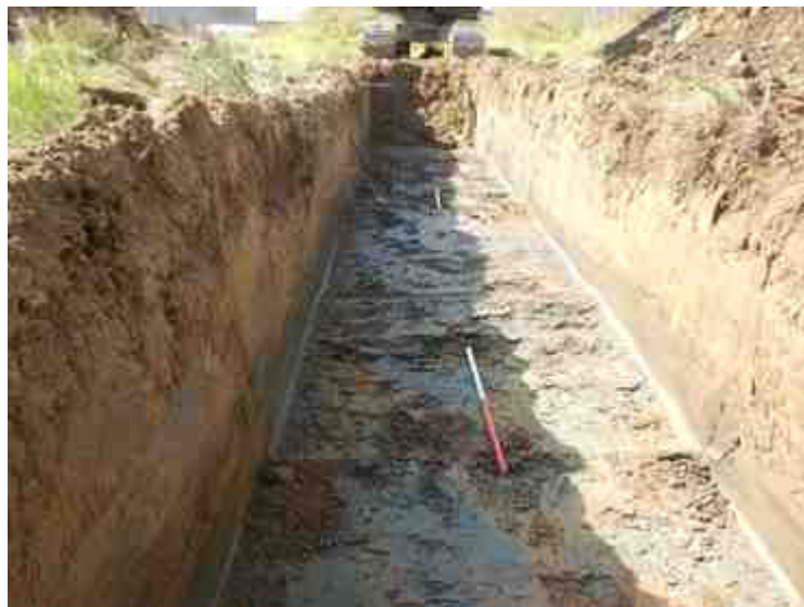
DSCN5154.JPG - Spoornummer(s): / - Inventarisnummer(s): / - Structuur: / - Zone/Werkput/Kijkvenster/Vlak: /3//