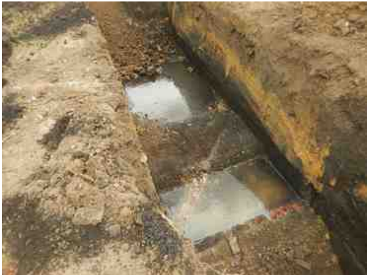
DSCN8914.JPG - Spoornummer(s): / - Inventarisnummer(s): / - Structuur: / - Zone/Werkput/Kijkvenster/Vlak: /6//