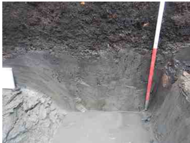
DSCN8848.JPG - Spoornummer(s): / - Inventarisnummer(s): / - Structuur: Profiel 2 - Zone/Werkput/Kijkvenster/Vlak: /