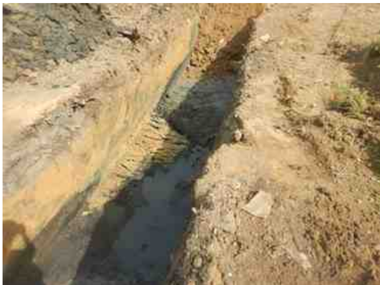
DSCN8855.JPG - Spoornummer(s): / - Inventarisnummer(s): / - Structuur: / - Zone/Werkput/Kijkvenster/Vlak: /2//