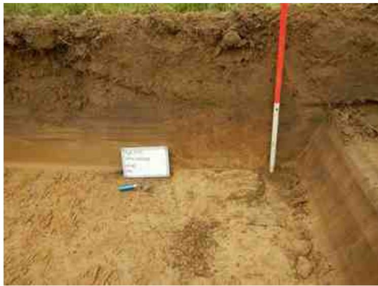
DSCN5082.JPG - Spoornummer(s): / - Inventarisnummer(s): / - Structuur: Profiel 5 - Zone/Werkput/Kijkvenster/Vlak: /