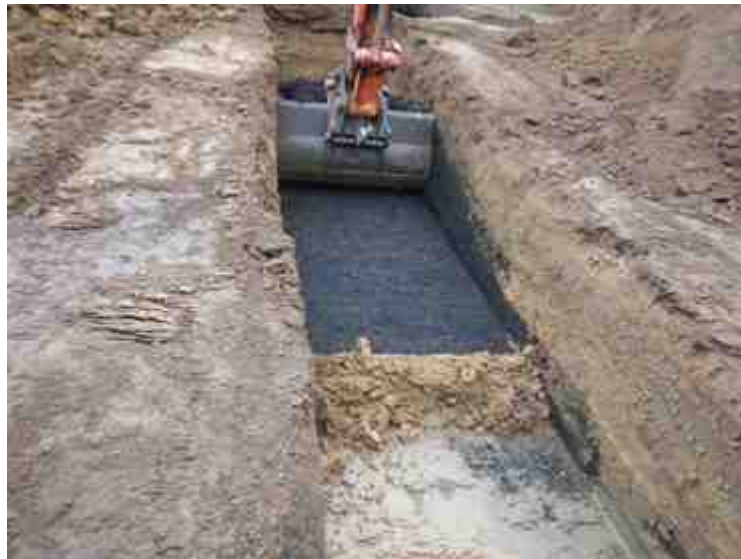
DSCN5058.JPG - Spoornummer(s): / - Inventarisnummer(s): / - Structuur: / - Zone/Werkput/Kijkvenster/Vlak: /5//