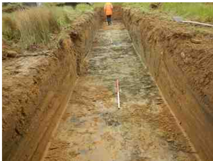
DSCN5104.JPG - Spoornummer(s): / - Inventarisnummer(s): / - Structuur: / - Zone/Werkput/Kijkvenster/Vlak: /4//