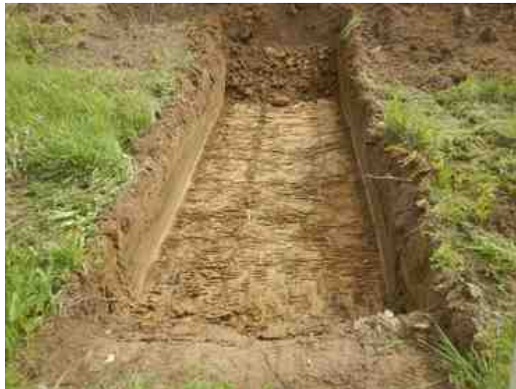
DSCN8932.JPG - Spoornummer(s): / - Inventarisnummer(s): / - Structuur: / - Zone/Werkput/Kijkvenster/Vlak: /5//