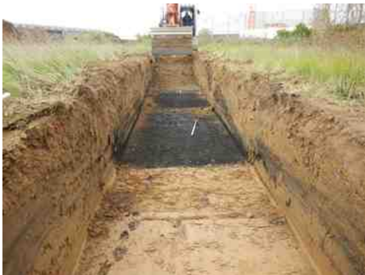
DSCN5147.JPG - Spoornummer(s): / - Inventarisnummer(s): / - Structuur: / - Zone/Werkput/Kijkvenster/Vlak: /3//