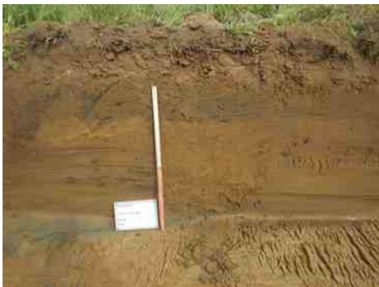
DSCN8935.JPG - Spoornummer(s): / - Inventarisnummer(s): / - Structuur: Profiel 4 - Zone/Werkput/Kijkvenster/Vlak: /