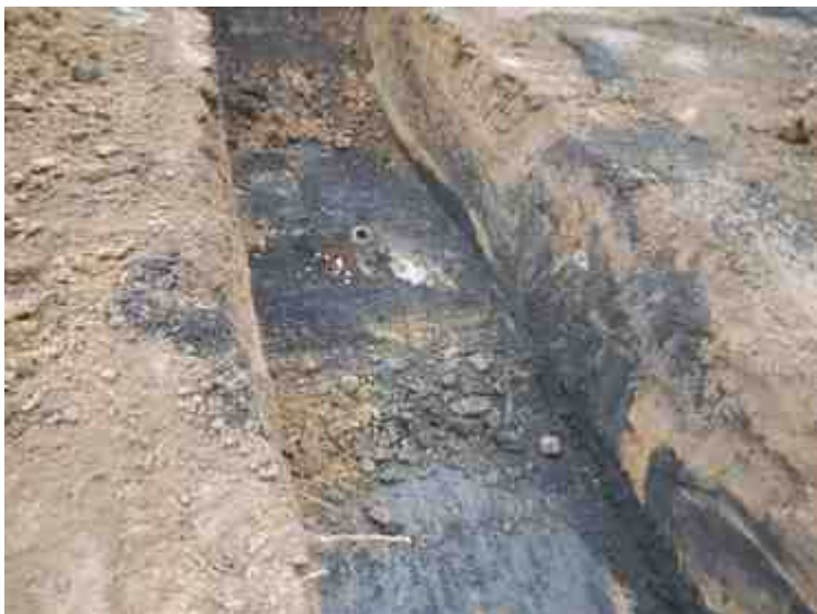
DSCN5062.JPG - Spoornummer(s): / - Inventarisnummer(s): / - Structuur: / - Zone/Werkput/Kijkvenster/Vlak: /5//