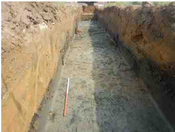
DSCN8861.JPG - Spoornummer(s): / - Inventarisnummer(s): / - Structuur: / - Zone/Werkput/Kijkvenster/Vlak: /2//