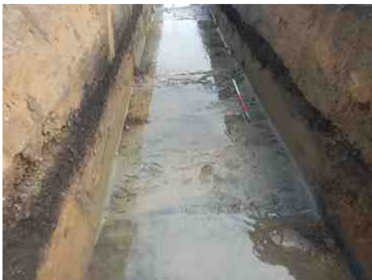
DSCN8823.JPG - Spoornummer(s): / - Inventarisnummer(s): / - Structuur: / - Zone/Werkput/Kijkvenster/Vlak: /1//