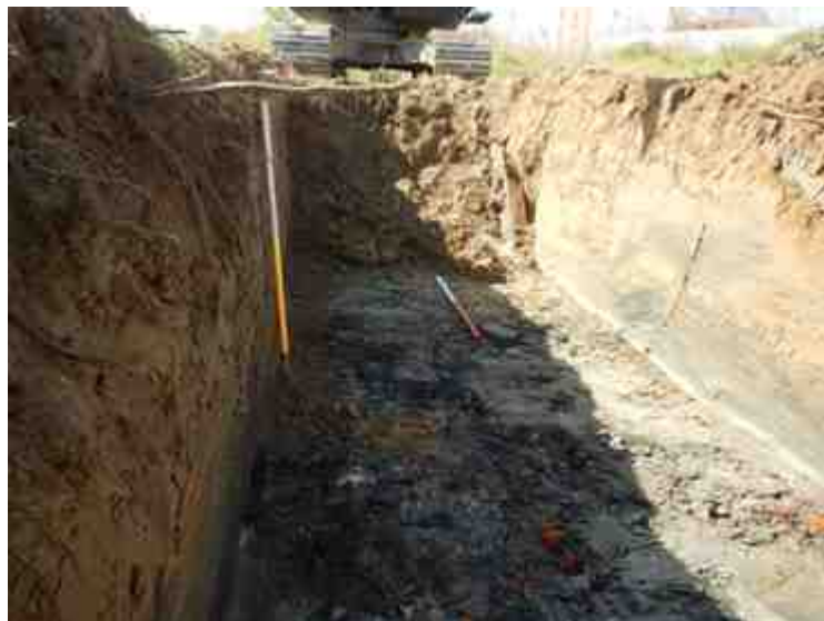
DSCN5156.JPG - Spoornummer(s): / - Inventarisnummer(s): / - Structuur: / - Zone/Werkput/Kijkvenster/Vlak: /3//