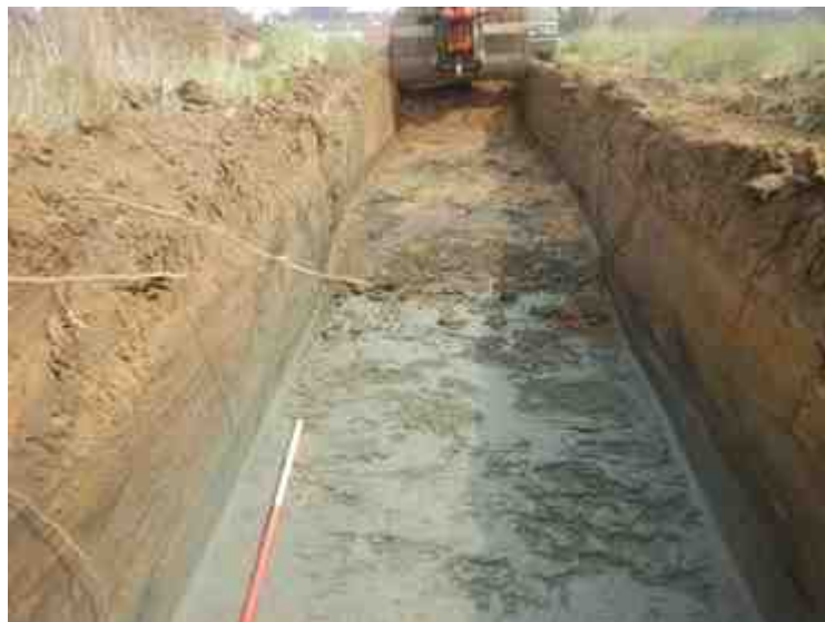
DSCN8864.JPG - Spoornummer(s): / - Inventarisnummer(s): / - Structuur: / - Zone/Werkput/Kijkvenster/Vlak: /2//