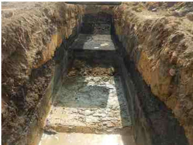
DSCN8902.JPG - Spoornummer(s): / - Inventarisnummer(s): / - Structuur: / - Zone/Werkput/Kijkvenster/Vlak: /6//