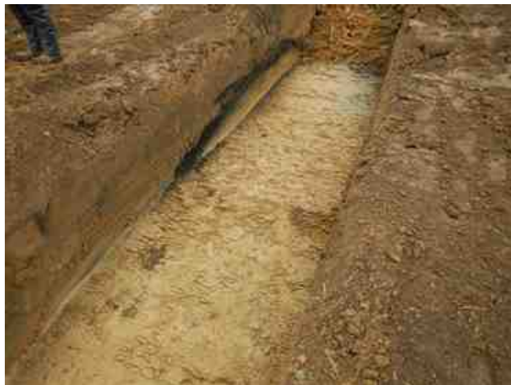
DSCN5056.JPG - Spoornummer(s): / - Inventarisnummer(s): / - Structuur: / - Zone/Werkput/Kijkvenster/Vlak: /5//