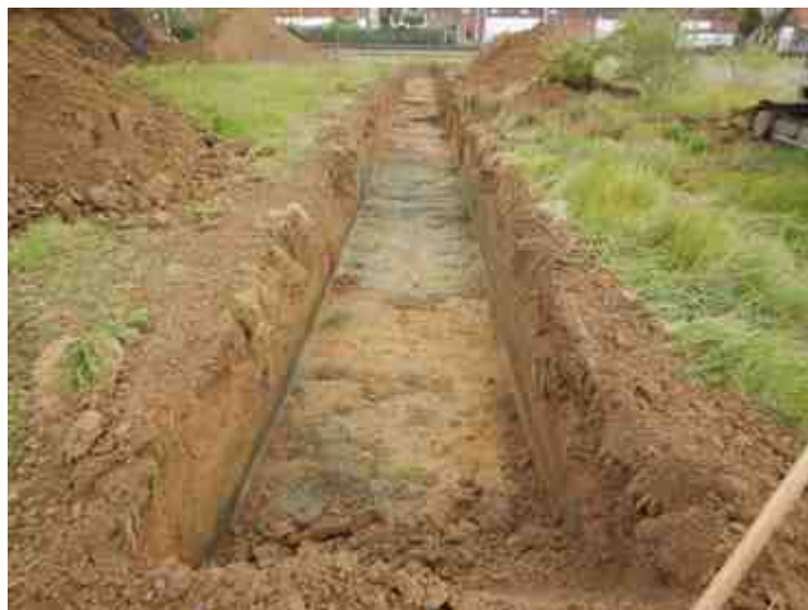
DSCN5108.JPG - Spoornummer(s): / - Inventarisnummer(s): / - Structuur: / - Zone/Werkput/Kijkvenster/Vlak: /4//