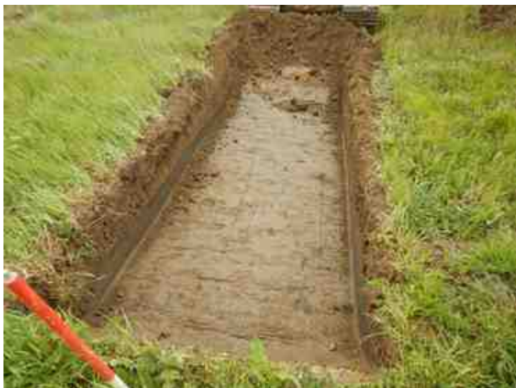
DSCN5134.JPG - Spoornummer(s): / - Inventarisnummer(s): / - Structuur: / - Zone/Werkput/Kijkvenster/Vlak: /3//