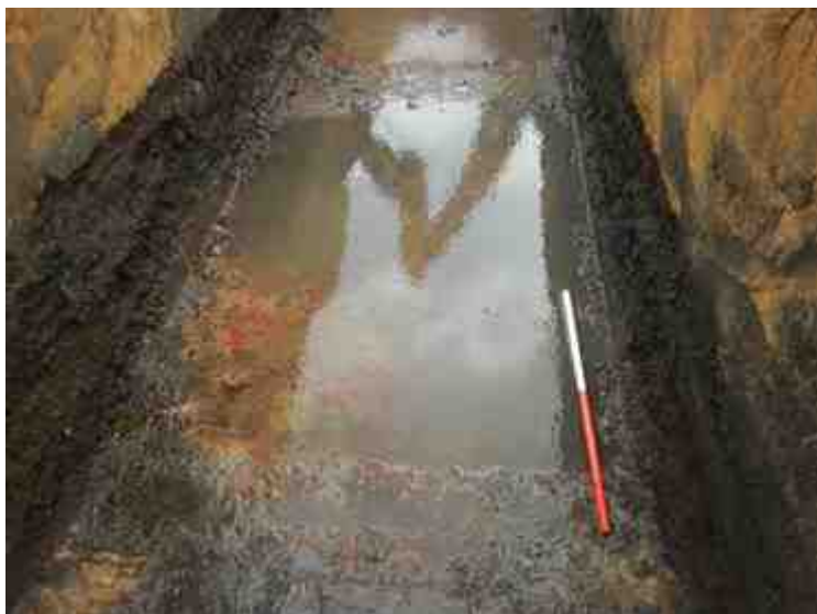
DSCN8923.JPG - Spoornummer(s): / - Inventarisnummer(s): / - Structuur: / - Zone/Werkput/Kijkvenster/Vlak: /6//