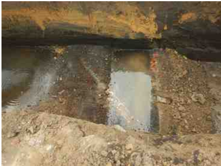
DSCN8913.JPG - Spoornummer(s): / - Inventarisnummer(s): / - Structuur: / - Zone/Werkput/Kijkvenster/Vlak: /6//