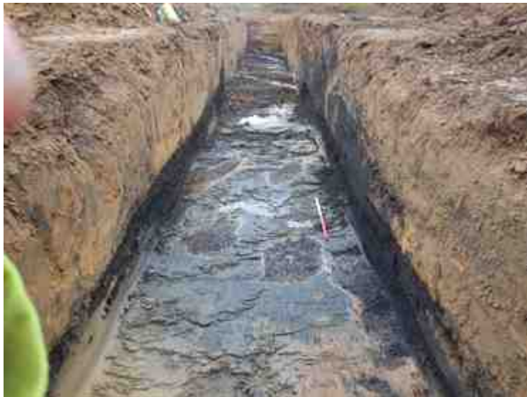
DSCN5068.JPG - Spoornummer(s): / - Inventarisnummer(s): / - Structuur: / - Zone/Werkput/Kijkvenster/Vlak: /5//