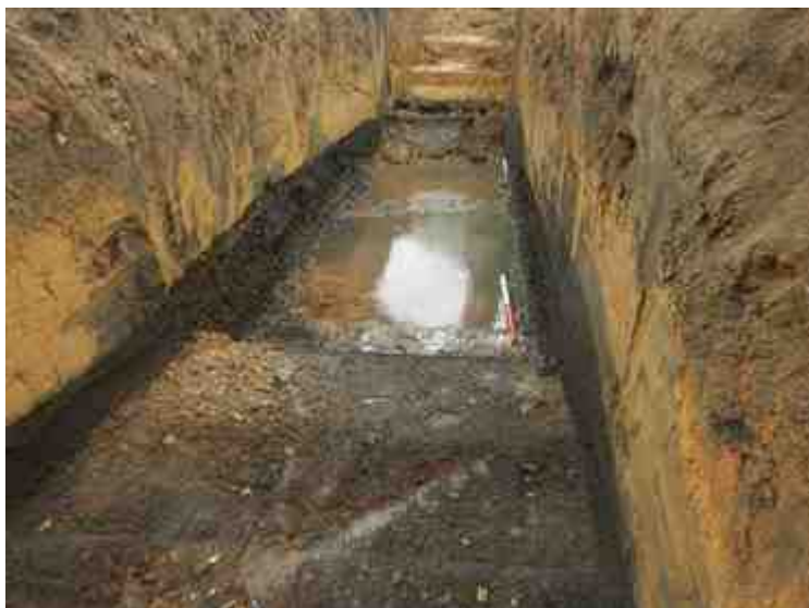
DSCN8922.JPG - Spoornummer(s): / - Inventarisnummer(s): / - Structuur: / - Zone/Werkput/Kijkvenster/Vlak: /6//