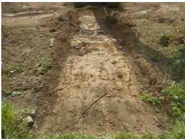
DSCN8888.JPG - Spoornummer(s): / - Inventarisnummer(s): / - Structuur: / - Zone/Werkput/Kijkvenster/Vlak: /6//