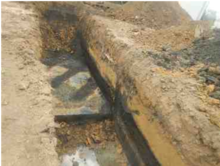
DSCN8912.JPG - Spoornummer(s): / - Inventarisnummer(s): / - Structuur: / - Zone/Werkput/Kijkvenster/Vlak: /6//