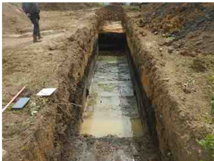
DSCN8906.JPG - Spoornummer(s): / - Inventarisnummer(s): / - Structuur: / - Zone/Werkput/Kijkvenster/Vlak: /6//