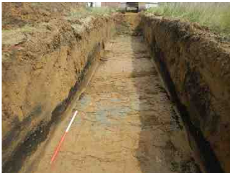
DSCN8875.JPG - Spoornummer(s): / - Inventarisnummer(s): / - Structuur: / - Zone/Werkput/Kijkvenster/Vlak: /2//