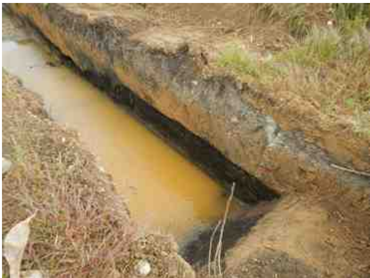
DSCN5116.JPG - Spoornummer(s): / - Inventarisnummer(s): / - Structuur: / - Zone/Werkput/Kijkvenster/Vlak: /1//