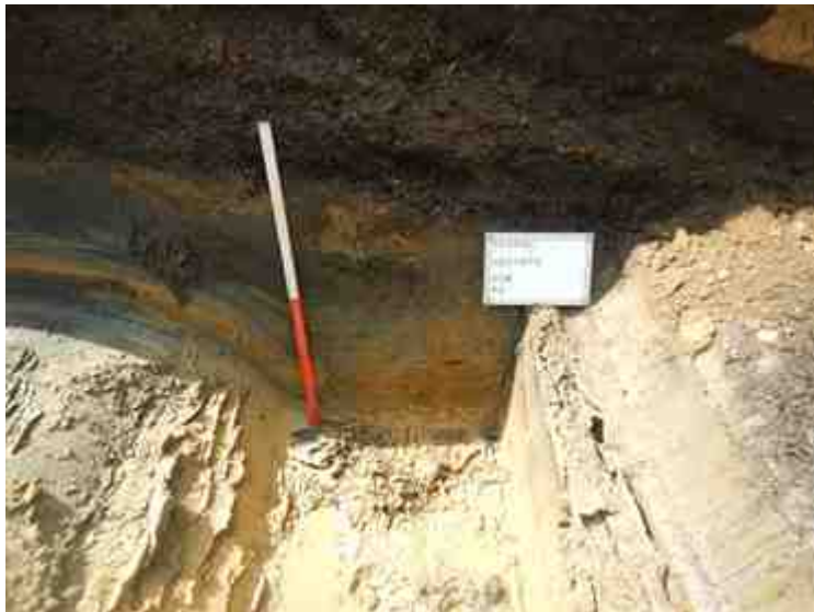
DSCN8899.JPG - Spoornummer(s): / - Inventarisnummer(s): / - Structuur: Profiel 3 - Zone/Werkput/Kijkvenster/Vlak: /