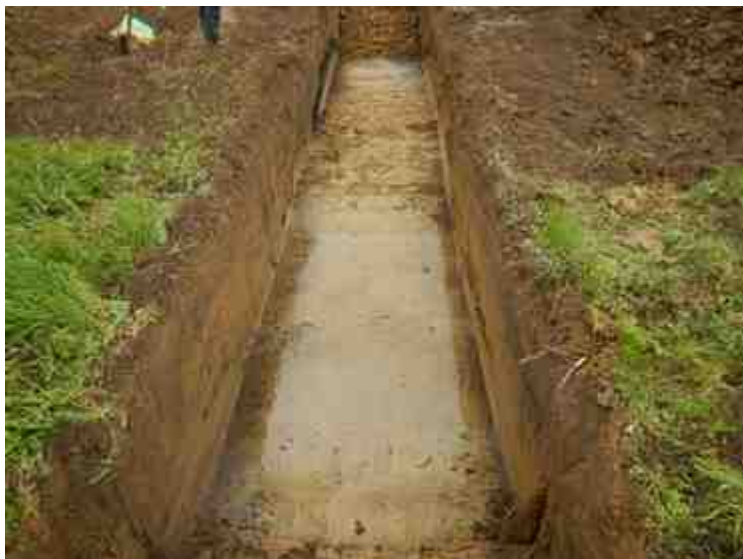
DSCN5055.JPG - Spoornummer(s): / - Inventarisnummer(s): / - Structuur: / - Zone/Werkput/Kijkvenster/Vlak: /5//