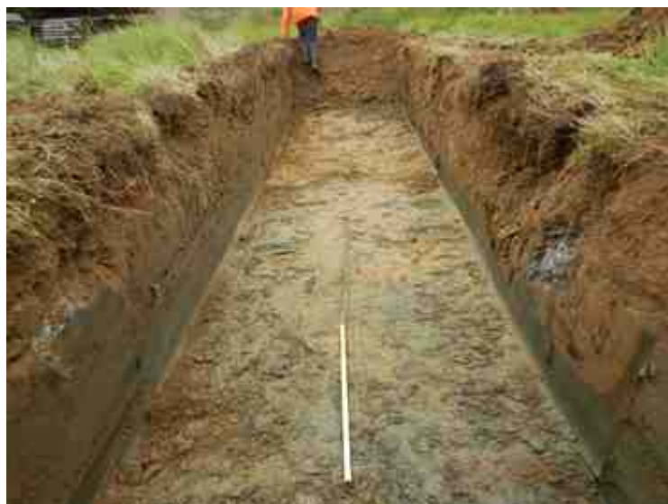
DSCN5106.JPG - Spoornummer(s): / - Inventarisnummer(s): / - Structuur: / - Zone/Werkput/Kijkvenster/Vlak: /4//