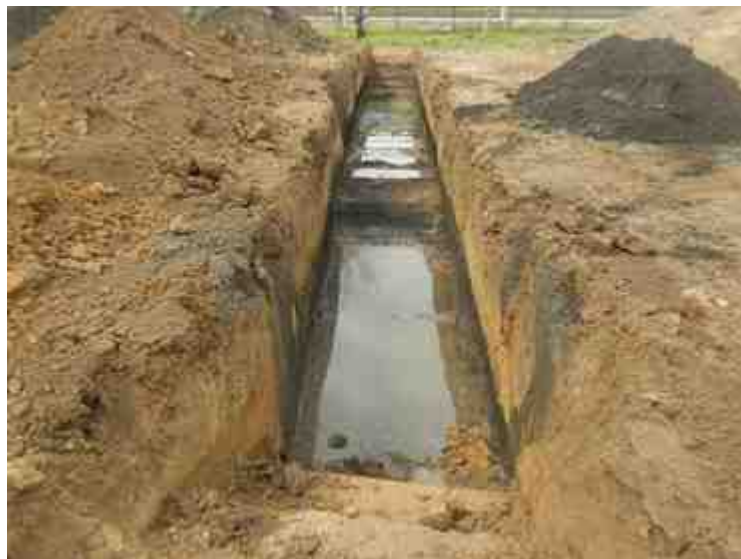
DSCN8926.JPG - Spoornummer(s): / - Inventarisnummer(s): / - Structuur: / - Zone/Werkput/Kijkvenster/Vlak: /6//