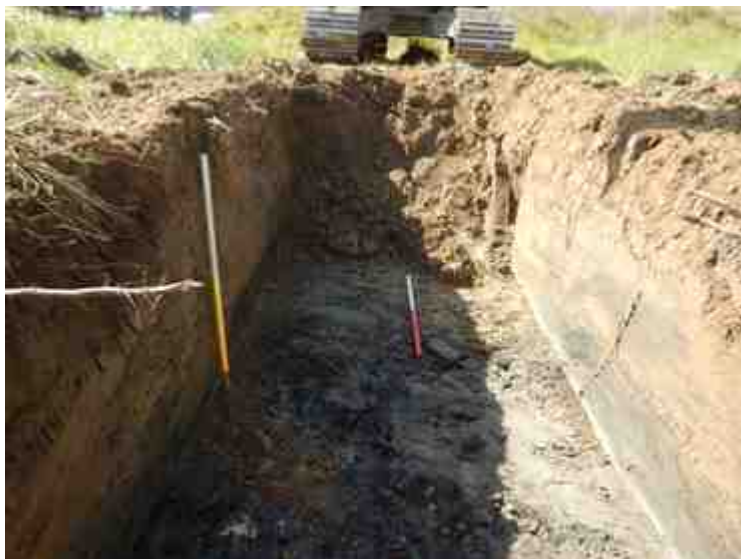
DSCN5155.JPG - Spoornummer(s): / - Inventarisnummer(s): / - Structuur: / - Zone/Werkput/Kijkvenster/Vlak: /3//