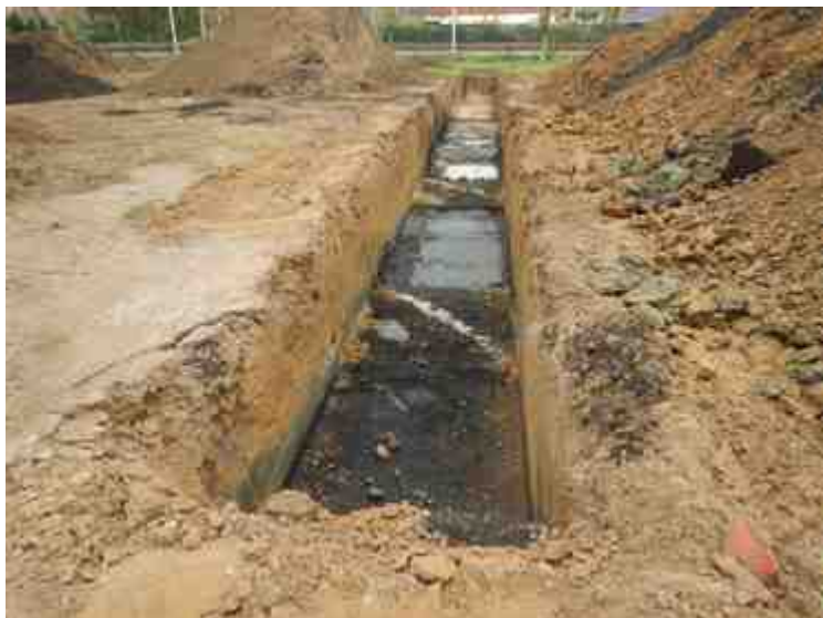
DSCN5123.JPG - Spoornummer(s): / - Inventarisnummer(s): / - Structuur: / - Zone/Werkput/Kijkvenster/Vlak: /5//