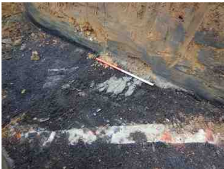
DSCN5074.JPG - Spoornummer(s): / - Inventarisnummer(s): / - Structuur: / - Zone/Werkput/Kijkvenster/Vlak: /5//