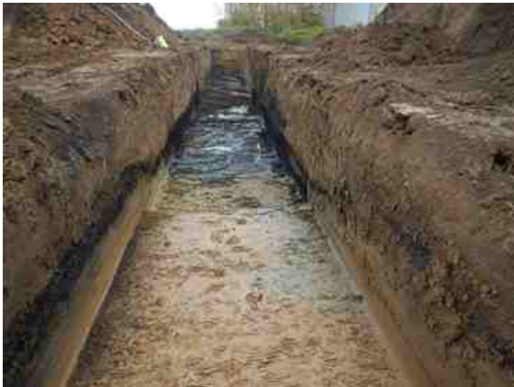
DSCN5067.JPG - Spoornummer(s): / - Inventarisnummer(s): / - Structuur: / - Zone/Werkput/Kijkvenster/Vlak: /5//