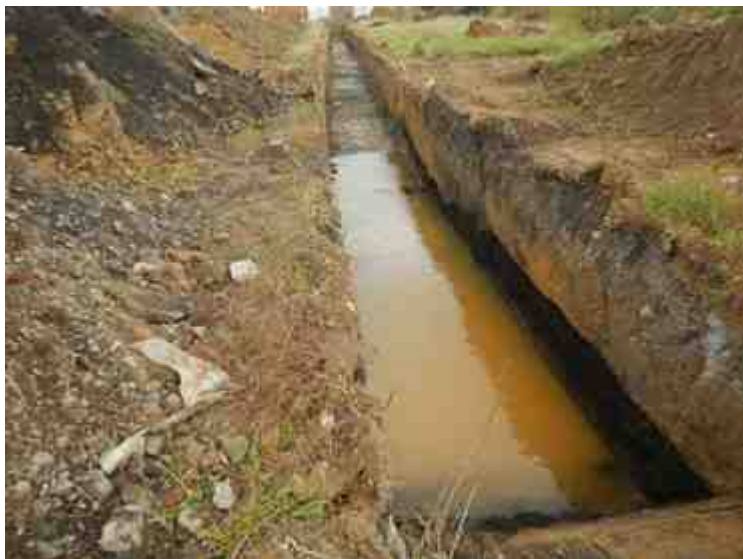
DSCN5117.JPG - Spoornummer(s): / - Inventarisnummer(s): / - Structuur: / - Zone/Werkput/Kijkvenster/Vlak: /1//