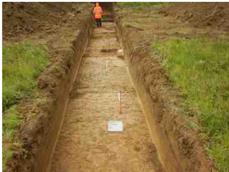
DSCN5086.JPG - Spoornummer(s): / - Inventarisnummer(s): / - Structuur: / - Zone/Werkput/Kijkvenster/Vlak: /4//