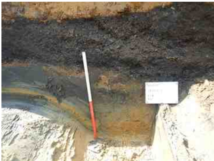
DSCN8900.JPG - Spoornummer(s): / - Inventarisnummer(s): / - Structuur: Profiel 3 - Zone/Werkput/Kijkvenster/Vlak: /