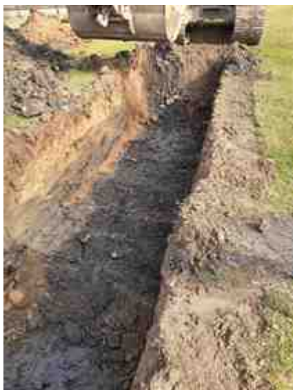
IMG_20210503_100433685_HDR.jpg - Spoornummer(s): / - Inventarisnummer(s): / - Structuur: / - Zone/Werkput/Kijkvenster/Vlak: /2//