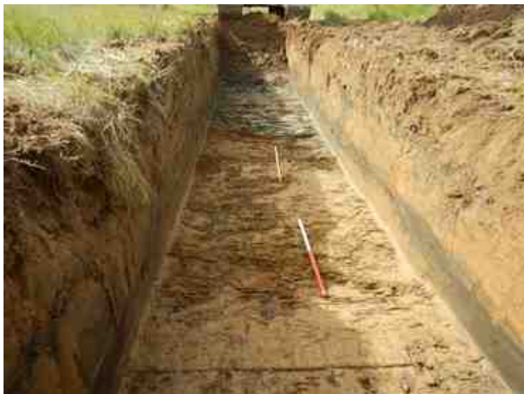
DSCN5149.JPG - Spoornummer(s): / - Inventarisnummer(s): / - Structuur: / - Zone/Werkput/Kijkvenster/Vlak: /3//