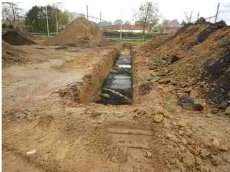
DSCN5122.JPG - Spoornummer(s): / - Inventarisnummer(s): / - Structuur: / - Zone/Werkput/Kijkvenster/Vlak: /5//