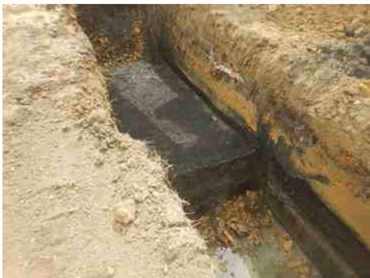
DSCN8909.JPG - Spoornummer(s): / - Inventarisnummer(s): / - Structuur: / - Zone/Werkput/Kijkvenster/Vlak: /6//