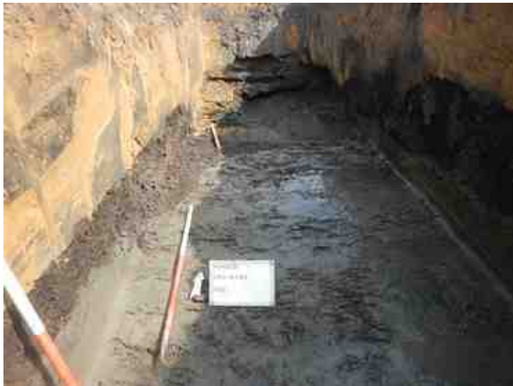
DSCN8851.JPG - Spoornummer(s): / - Inventarisnummer(s): / - Structuur: / - Zone/Werkput/Kijkvenster/Vlak: /2//