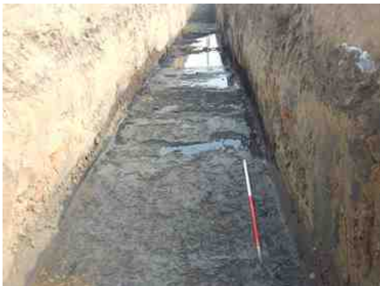
DSCN8827.JPG - Spoornummer(s): / - Inventarisnummer(s): / - Structuur: / - Zone/Werkput/Kijkvenster/Vlak: /1//