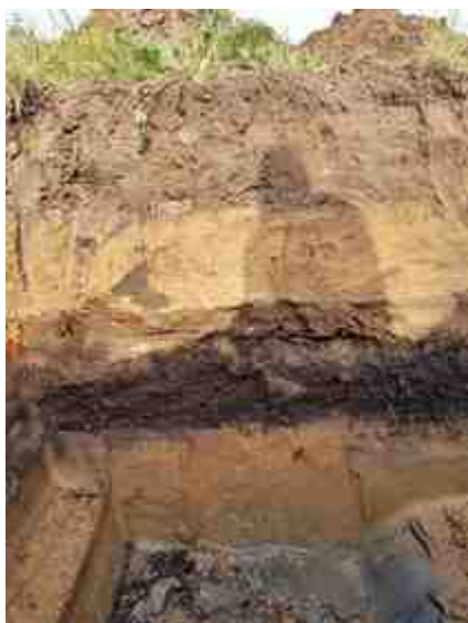
IMG_20210503_085508004_HDR.jpg - Spoornummer(s): / - Inventarisnummer(s): / - Structuur: / - Zone/Werkput/Kijkvenster/Vlak: /1//