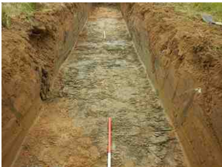
DSCN5105.JPG - Spoornummer(s): / - Inventarisnummer(s): / - Structuur: / - Zone/Werkput/Kijkvenster/Vlak: /4//