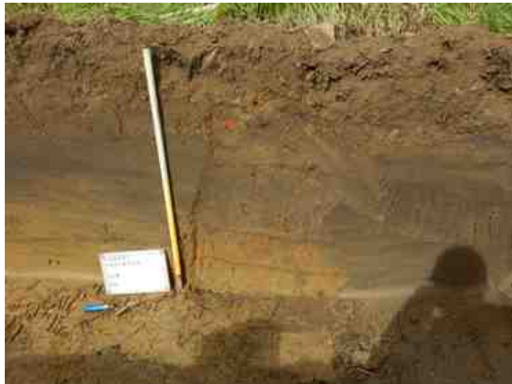
DSCN5139.JPG - Spoornummer(s): / - Inventarisnummer(s): / - Structuur: Profiel 6 - Zone/Werkput/Kijkvenster/Vlak: /