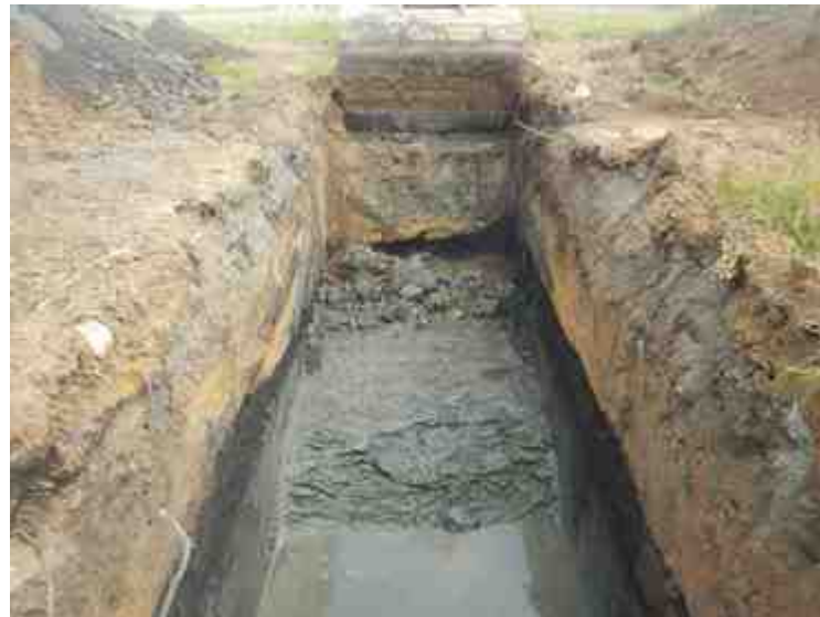
DSCN8850.JPG - Spoornummer(s): / - Inventarisnummer(s): / - Structuur: / - Zone/Werkput/Kijkvenster/Vlak: /2//