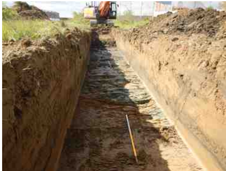
DSCN5152.JPG - Spoornummer(s): / - Inventarisnummer(s): / - Structuur: / - Zone/Werkput/Kijkvenster/Vlak: /3//