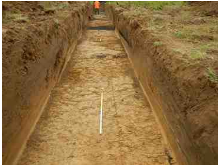
DSCN5096.JPG - Spoornummer(s): / - Inventarisnummer(s): / - Structuur: / - Zone/Werkput/Kijkvenster/Vlak: /4//