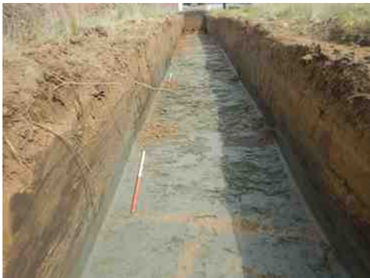
DSCN8865.JPG - Spoornummer(s): / - Inventarisnummer(s): / - Structuur: / - Zone/Werkput/Kijkvenster/Vlak: /2//