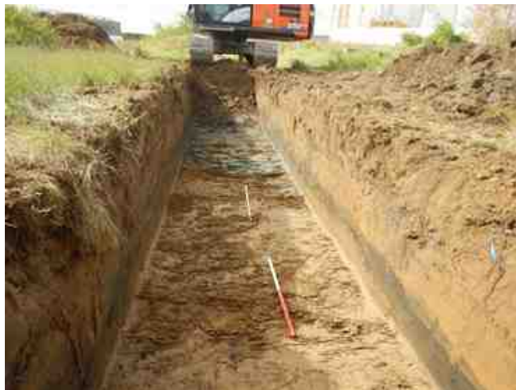
DSCN5150.JPG - Spoornummer(s): / - Inventarisnummer(s): / - Structuur: / - Zone/Werkput/Kijkvenster/Vlak: /3//