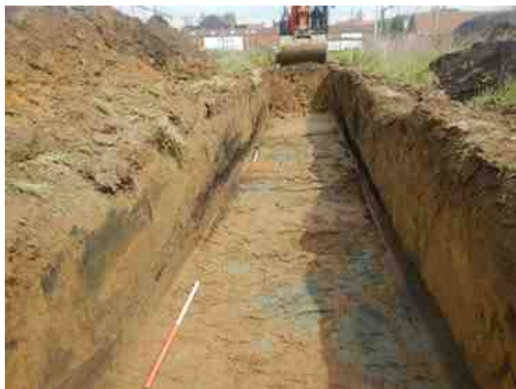
DSCN8870.JPG - Spoornummer(s): / - Inventarisnummer(s): / - Structuur: / - Zone/Werkput/Kijkvenster/Vlak: /2//