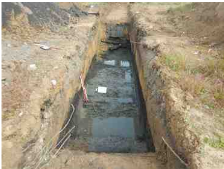
DSCN8853.JPG - Spoornummer(s): / - Inventarisnummer(s): / - Structuur: / - Zone/Werkput/Kijkvenster/Vlak: /2//