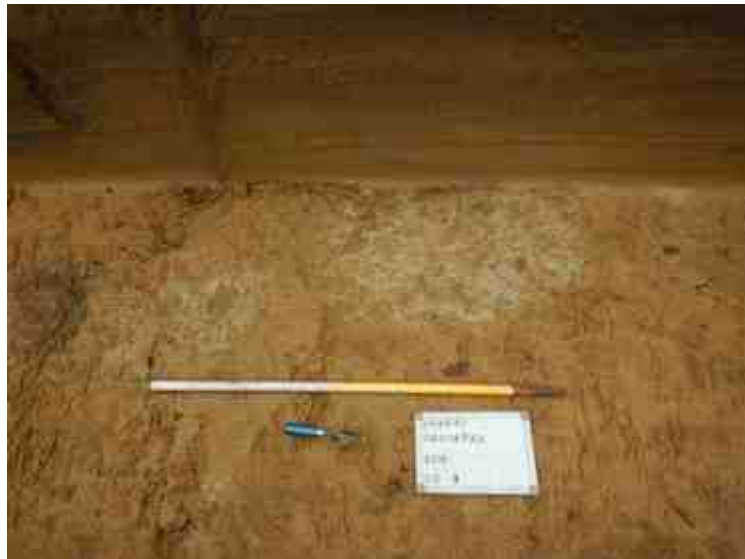
DSCN5090.JPG - Spoornummer(s): 1, 2 - Inventarisnummer(s): / - Structuur: / - Zone/Werkput/Kijkvenster/Vlak: /