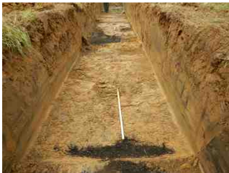
DSCN5100.JPG - Spoornummer(s): / - Inventarisnummer(s): / - Structuur: / - Zone/Werkput/Kijkvenster/Vlak: /4//