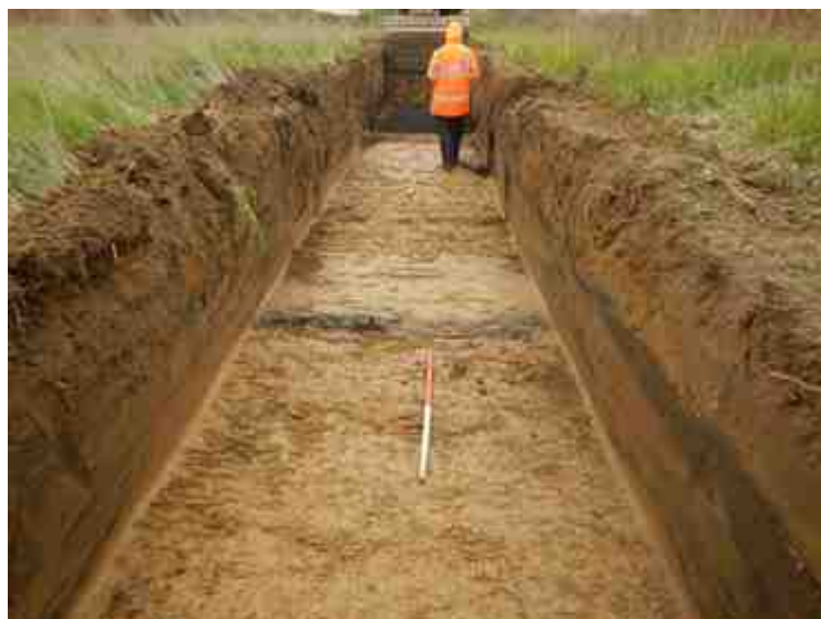
DSCN5144.JPG - Spoornummer(s): / - Inventarisnummer(s): / - Structuur: / - Zone/Werkput/Kijkvenster/Vlak: /3//