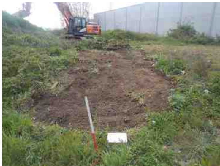
DSCN8887.JPG - Spoornummer(s): / - Inventarisnummer(s): / - Structuur: / - Zone/Werkput/Kijkvenster/Vlak: /6//