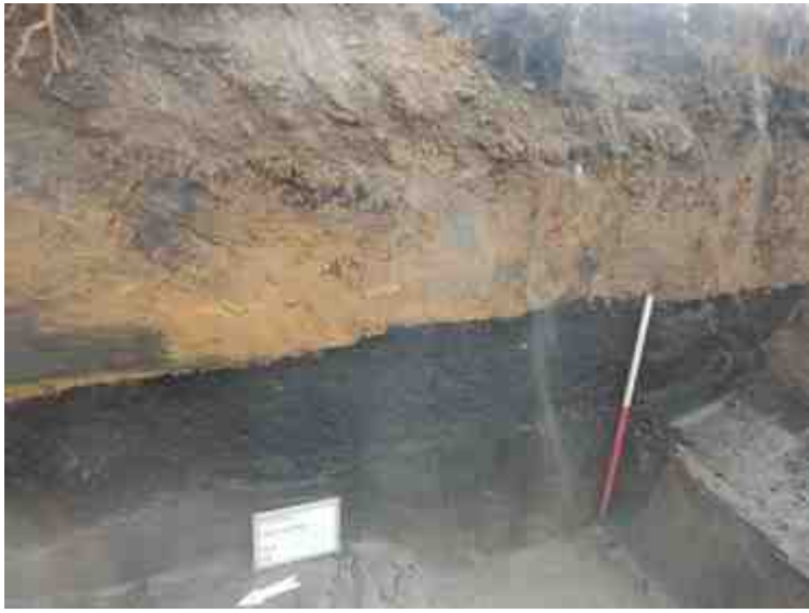
DSCN8842.JPG - Spoornummer(s): / - Inventarisnummer(s): / - Structuur: Profiel 2 - Zone/Werkput/Kijkvenster/Vlak: /