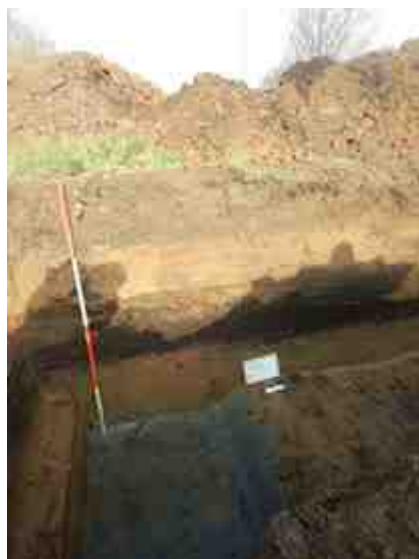
DSCN8822.JPG - Spoornummer(s): / - Inventarisnummer(s): / - Structuur: Profiel 1 - Zone/Werkput/Kijkvenster/Vlak: /