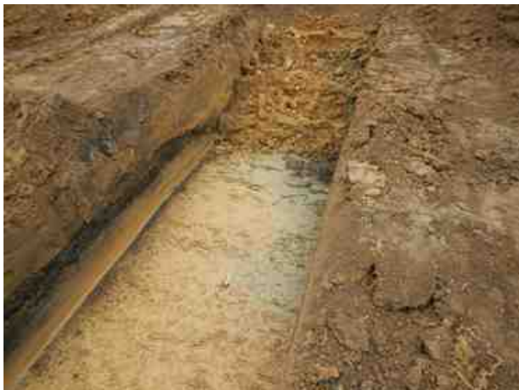
DSCN5057.JPG - Spoornummer(s): / - Inventarisnummer(s): / - Structuur: / - Zone/Werkput/Kijkvenster/Vlak: /5//