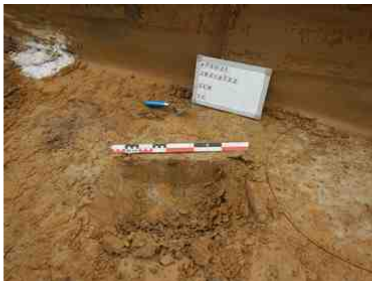
DSCN5092.JPG - Spoornummer(s): 1 - Inventarisnummer(s): / - Structuur: / - Zone/Werkput/Kijkvenster/Vlak: /