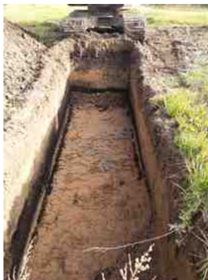
IMG_20210503_084522969.jpg - Spoornummer(s): / - Inventarisnummer(s): / - Structuur: / - Zone/Werkput/Kijkvenster/Vlak: /1//