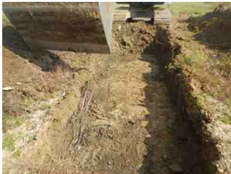
DSCN8836.JPG - Spoornummer(s): / - Inventarisnummer(s): / - Structuur: / - Zone/Werkput/Kijkvenster/Vlak: /2//