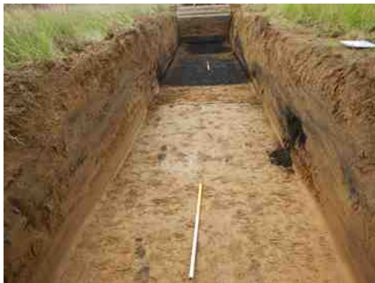
DSCN5146.JPG - Spoornummer(s): / - Inventarisnummer(s): / - Structuur: / - Zone/Werkput/Kijkvenster/Vlak: /3//