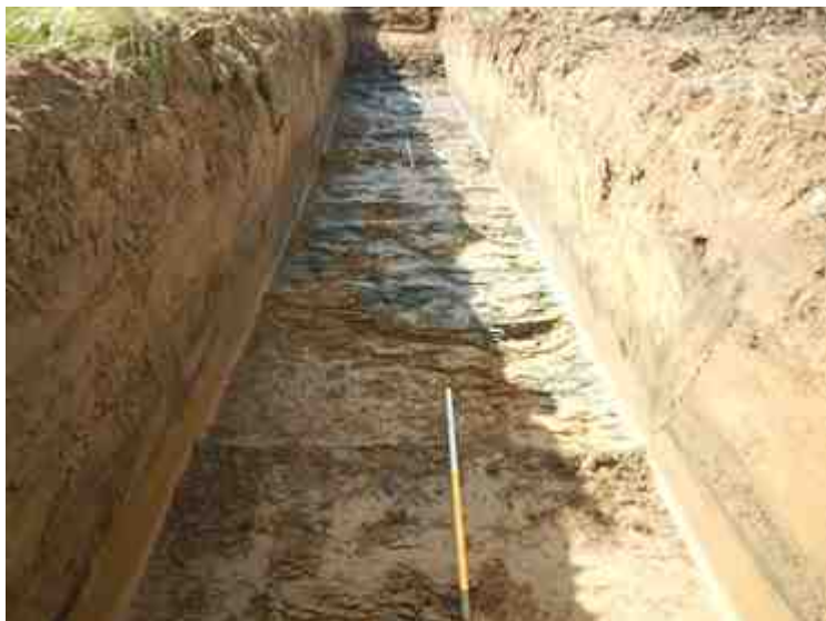
DSCN5151.JPG - Spoornummer(s): / - Inventarisnummer(s): / - Structuur: / - Zone/Werkput/Kijkvenster/Vlak: /3//