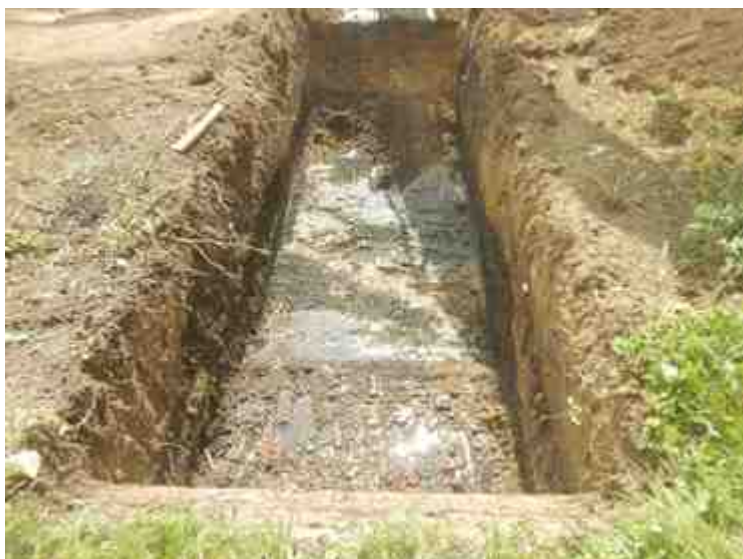
DSCN8895.JPG - Spoornummer(s): / - Inventarisnummer(s): / - Structuur: / - Zone/Werkput/Kijkvenster/Vlak: /6//