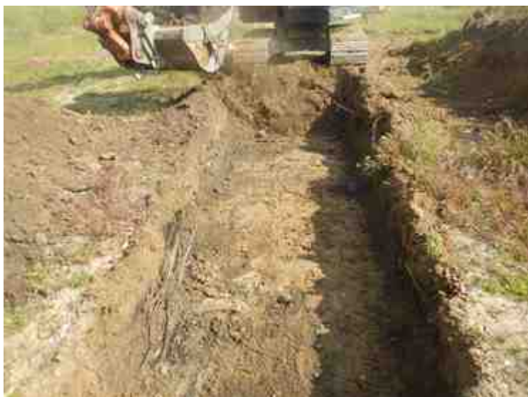
DSCN8835.JPG - Spoornummer(s): / - Inventarisnummer(s): / - Structuur: / - Zone/Werkput/Kijkvenster/Vlak: /2//