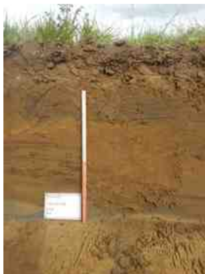
DSCN8936.JPG - Spoornummer(s): / - Inventarisnummer(s): / - Structuur: Profiel 4 - Zone/Werkput/Kijkvenster/Vlak: /