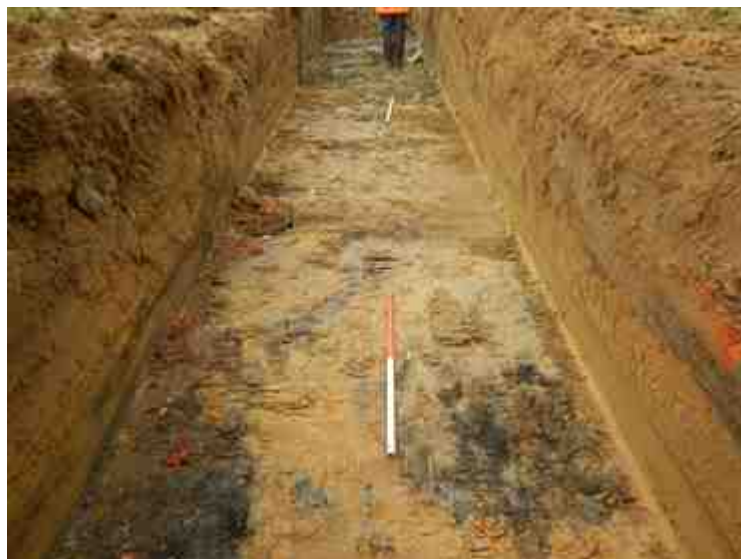
DSCN5102.JPG - Spoornummer(s): / - Inventarisnummer(s): / - Structuur: / - Zone/Werkput/Kijkvenster/Vlak: /4//