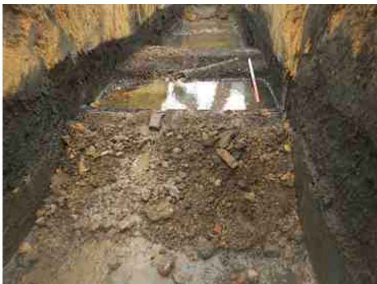
DSCN8920.JPG - Spoornummer(s): / - Inventarisnummer(s): / - Structuur: / - Zone/Werkput/Kijkvenster/Vlak: /6//