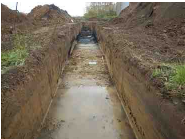
DSCN5066.JPG - Spoornummer(s): / - Inventarisnummer(s): / - Structuur: / - Zone/Werkput/Kijkvenster/Vlak: /5//