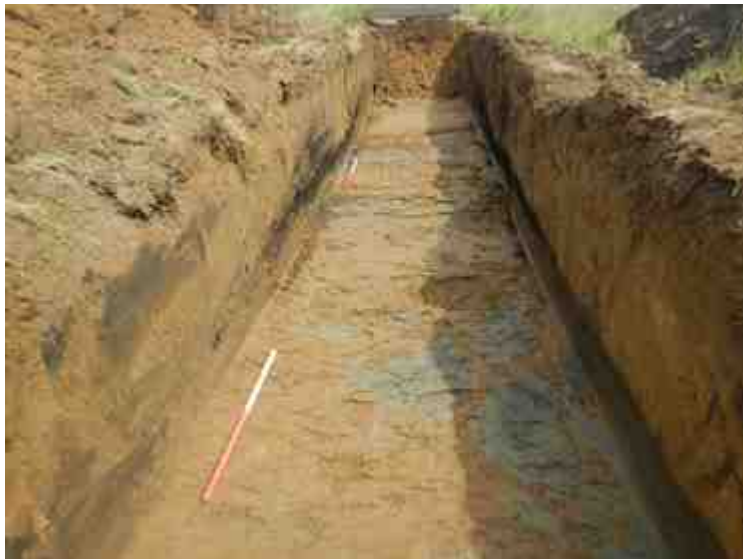
DSCN8869.JPG - Spoornummer(s): / - Inventarisnummer(s): / - Structuur: / - Zone/Werkput/Kijkvenster/Vlak: /2//