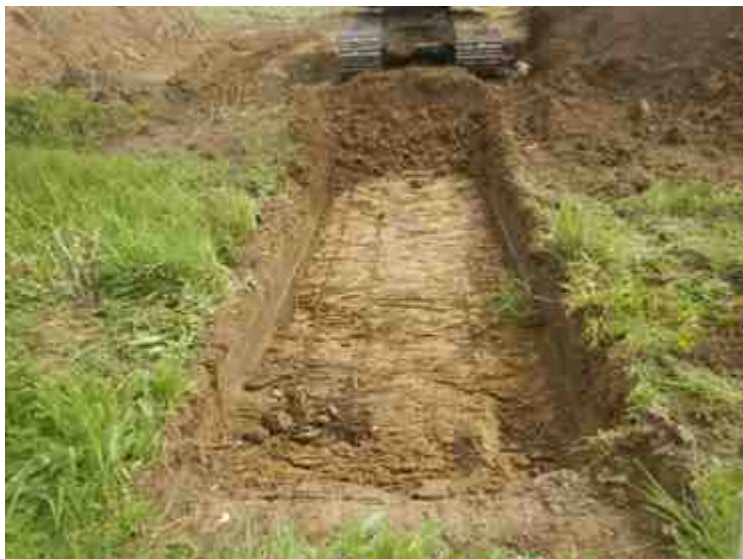
DSCN8931.JPG - Spoornummer(s): / - Inventarisnummer(s): / - Structuur: / - Zone/Werkput/Kijkvenster/Vlak: /5//