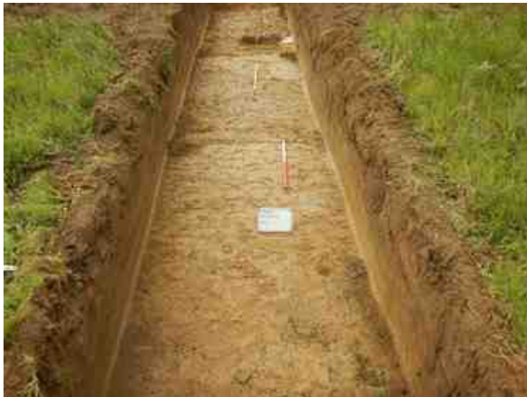
DSCN5085.JPG - Spoornummer(s): / - Inventarisnummer(s): / - Structuur: / - Zone/Werkput/Kijkvenster/Vlak: /4//