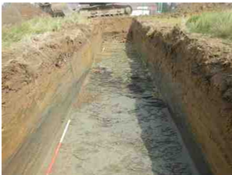
DSCN8879.JPG - Spoornummer(s): / - Inventarisnummer(s): / - Structuur: / - Zone/Werkput/Kijkvenster/Vlak: /2//