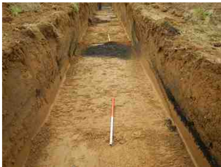
DSCN5098.JPG - Spoornummer(s): / - Inventarisnummer(s): / - Structuur: / - Zone/Werkput/Kijkvenster/Vlak: /4//