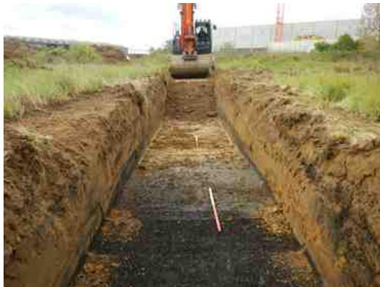
DSCN5148.JPG - Spoornummer(s): / - Inventarisnummer(s): / - Structuur: / - Zone/Werkput/Kijkvenster/Vlak: /3//