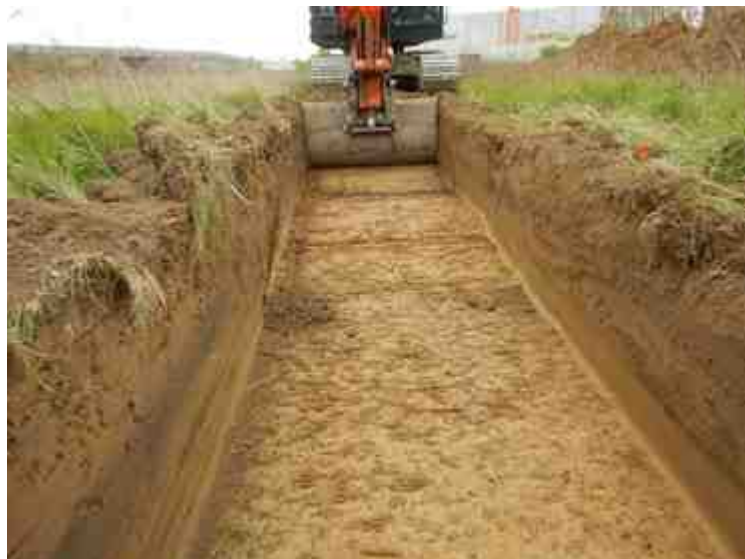
DSCN5137.JPG - Spoornummer(s): / - Inventarisnummer(s): / - Structuur: / - Zone/Werkput/Kijkvenster/Vlak: /3//