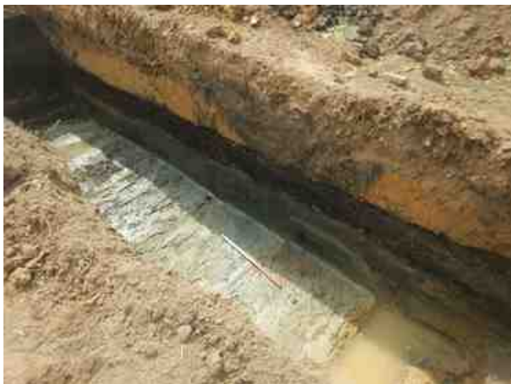
DSCN8904.JPG - Spoornummer(s): / - Inventarisnummer(s): / - Structuur: / - Zone/Werkput/Kijkvenster/Vlak: /6//