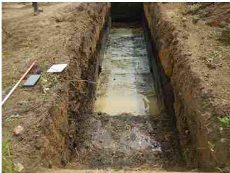
DSCN8905.JPG - Spoornummer(s): / - Inventarisnummer(s): / - Structuur: / - Zone/Werkput/Kijkvenster/Vlak: /6//