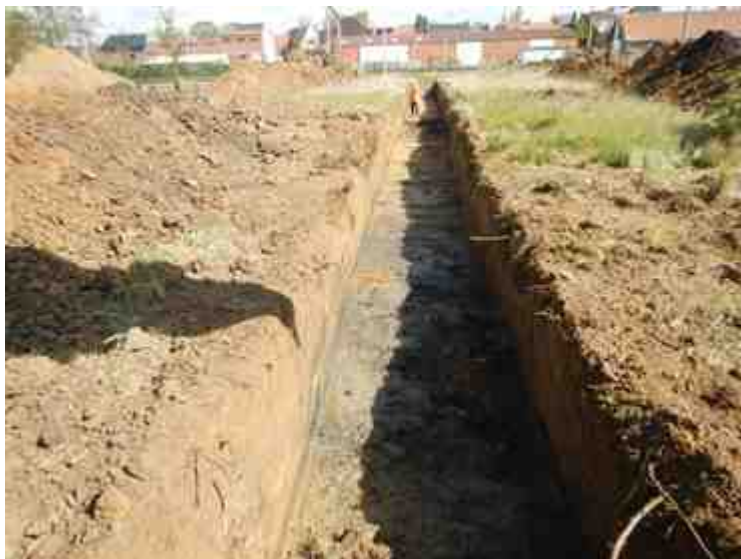
DSCN5157.JPG - Spoornummer(s): / - Inventarisnummer(s): / - Structuur: / - Zone/Werkput/Kijkvenster/Vlak: /3//