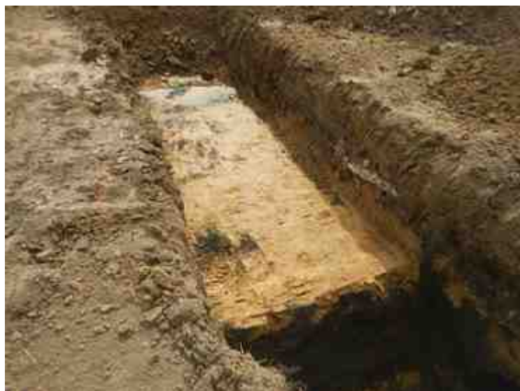
DSCN8908.JPG - Spoornummer(s): / - Inventarisnummer(s): / - Structuur: / - Zone/Werkput/Kijkvenster/Vlak: /6//