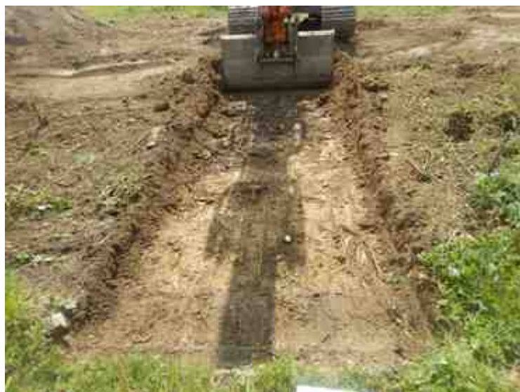
DSCN8890.JPG - Spoornummer(s): / - Inventarisnummer(s): / - Structuur: / - Zone/Werkput/Kijkvenster/Vlak: /6//