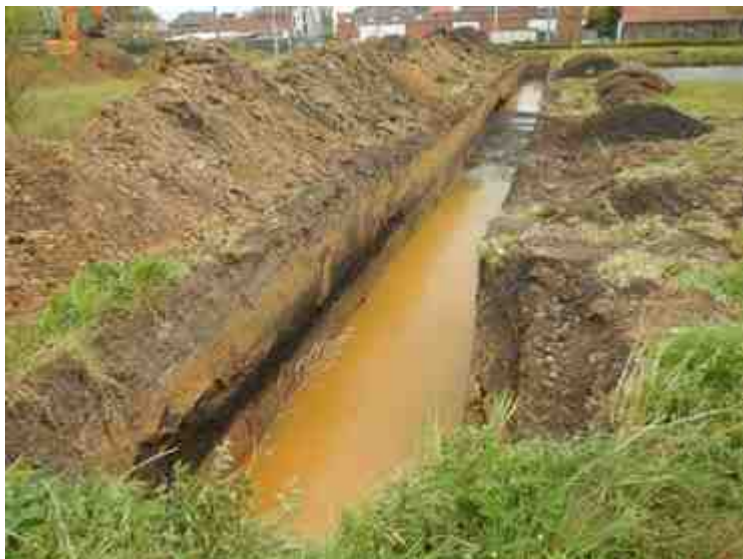
DSCN5119.JPG - Spoornummer(s): / - Inventarisnummer(s): / - Structuur: / - Zone/Werkput/Kijkvenster/Vlak: /1//