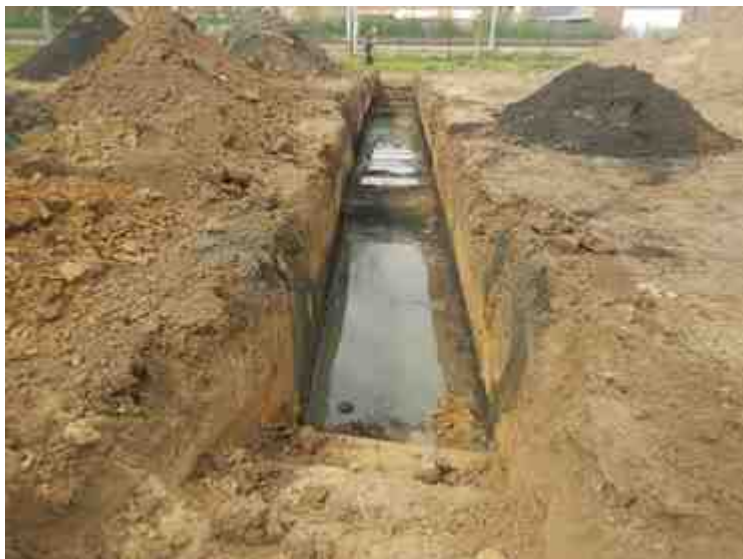
DSCN8925.JPG - Spoornummer(s): / - Inventarisnummer(s): / - Structuur: / - Zone/Werkput/Kijkvenster/Vlak: /6//