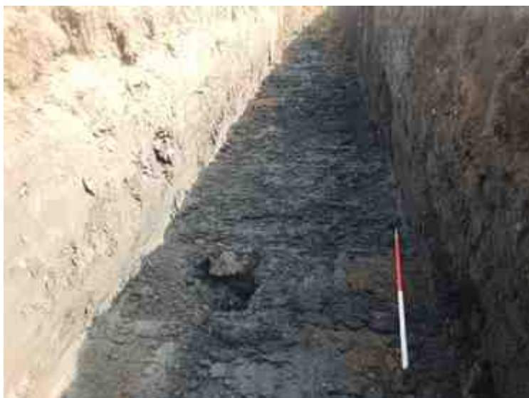
DSCN8831.JPG - Spoornummer(s): / - Inventarisnummer(s): / - Structuur: / - Zone/Werkput/Kijkvenster/Vlak: /1//