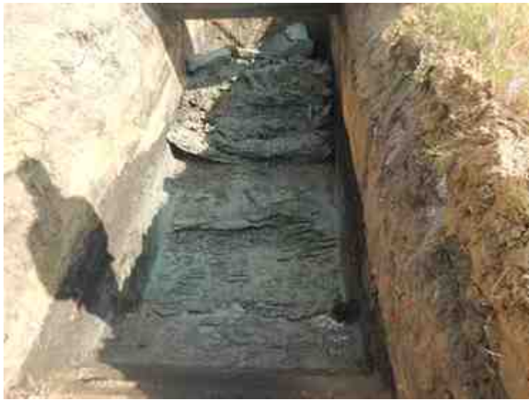
DSCN8841.JPG - Spoornummer(s): / - Inventarisnummer(s): / - Structuur: / - Zone/Werkput/Kijkvenster/Vlak: /2//