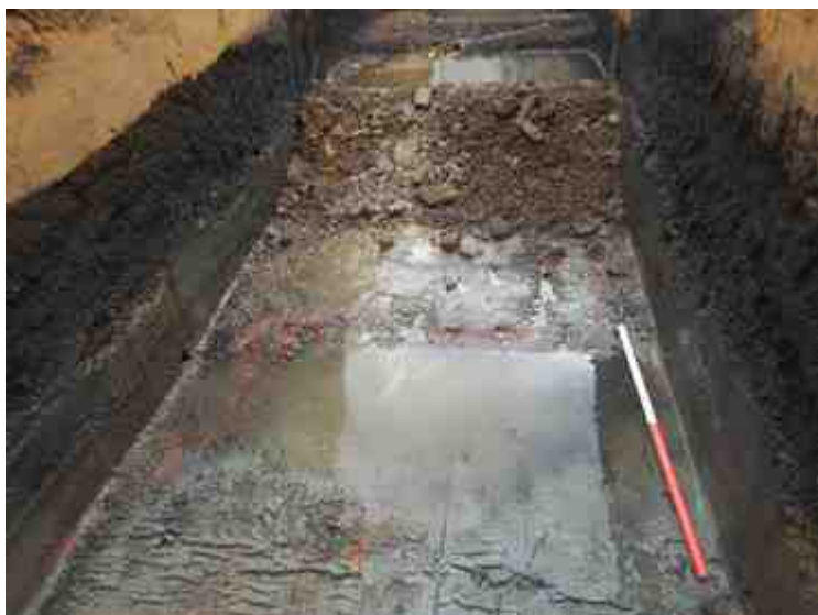
DSCN8919.JPG - Spoornummer(s): / - Inventarisnummer(s): / - Structuur: / - Zone/Werkput/Kijkvenster/Vlak: /6//