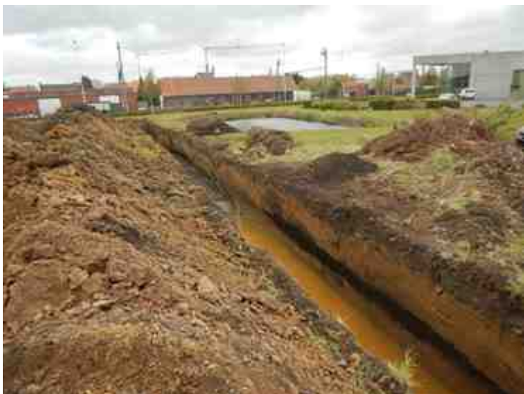
DSCN5120.JPG - Spoornummer(s): / - Inventarisnummer(s): / - Structuur: / - Zone/Werkput/Kijkvenster/Vlak: /1//