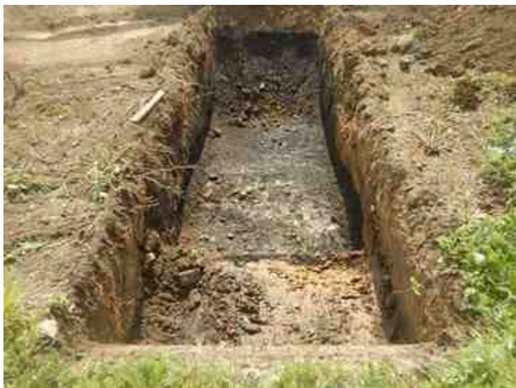
DSCN8893.JPG - Spoornummer(s): / - Inventarisnummer(s): / - Structuur: / - Zone/Werkput/Kijkvenster/Vlak: /6//