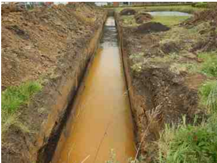
DSCN5118.JPG - Spoornummer(s): / - Inventarisnummer(s): / - Structuur: / - Zone/Werkput/Kijkvenster/Vlak: /1//