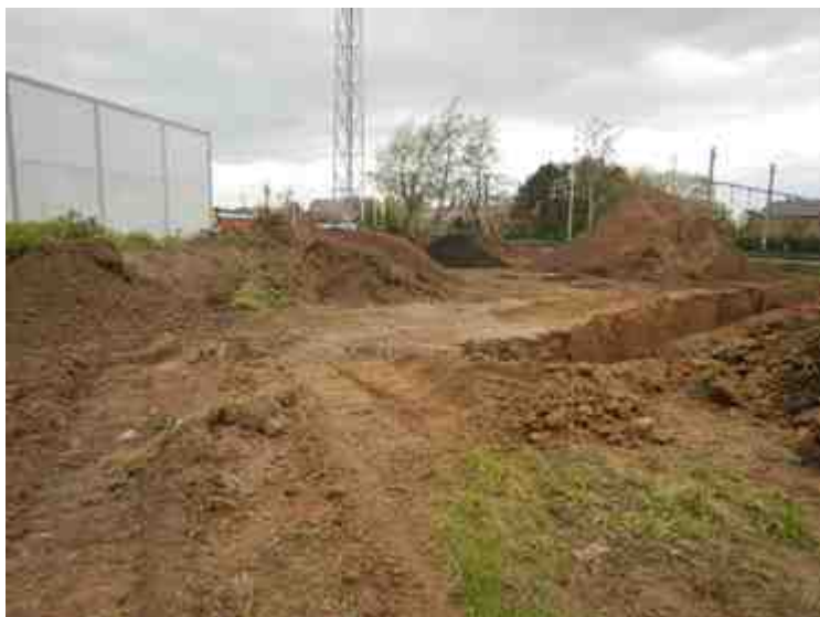
DSCN5121.JPG - Spoornummer(s): / - Inventarisnummer(s): / - Structuur: / - Zone/Werkput/Kijkvenster/Vlak: /5//, /6//