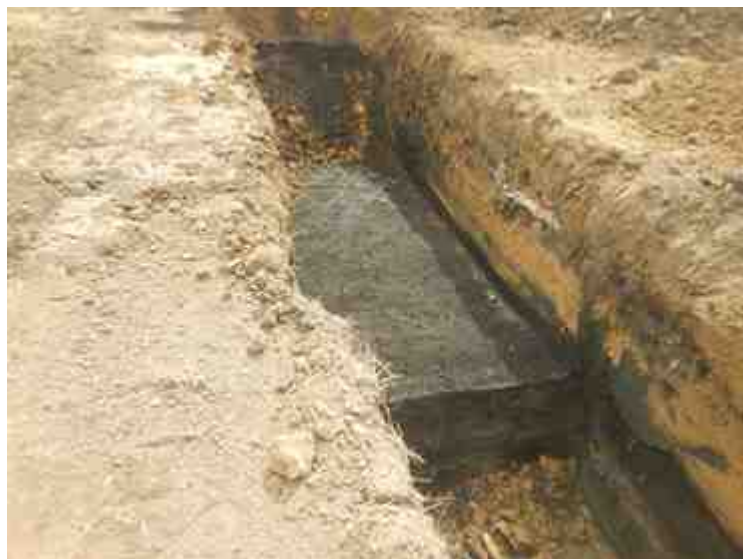
DSCN8910.JPG - Spoornummer(s): / - Inventarisnummer(s): / - Structuur: / - Zone/Werkput/Kijkvenster/Vlak: /6//