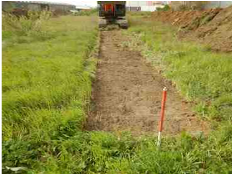
DSCN5128.JPG - Spoornummer(s): / - Inventarisnummer(s): / - Structuur: / - Zone/Werkput/Kijkvenster/Vlak: /3//