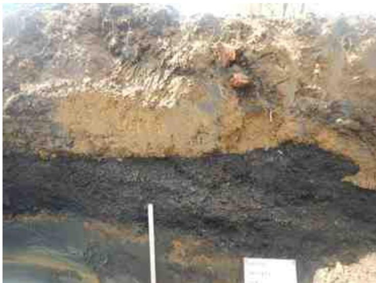
DSCN8901.JPG - Spoornummer(s): / - Inventarisnummer(s): / - Structuur: Profiel 3 - Zone/Werkput/Kijkvenster/Vlak: /