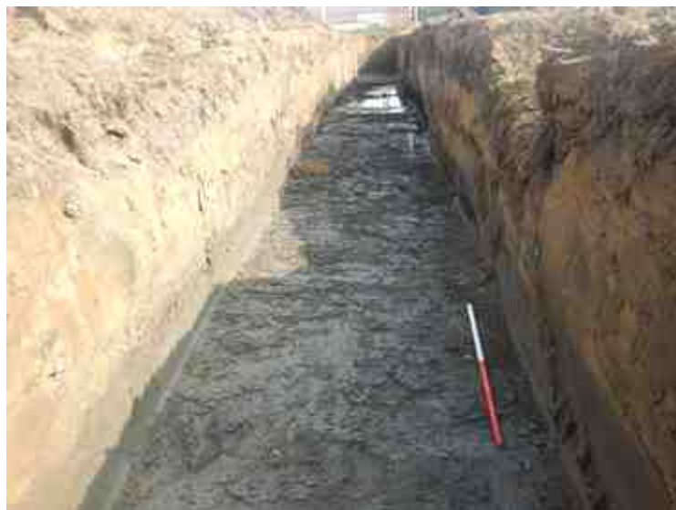
DSCN8826.JPG - Spoornummer(s): / - Inventarisnummer(s): / - Structuur: / - Zone/Werkput/Kijkvenster/Vlak: /1//