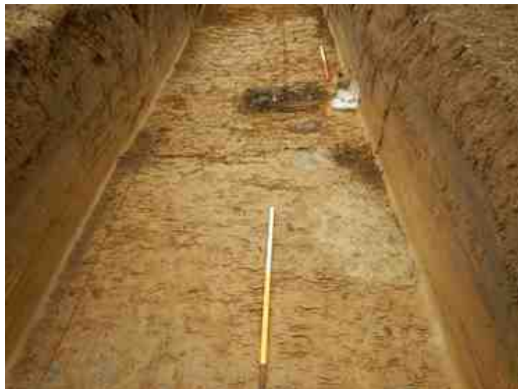
DSCN5088.JPG - Spoornummer(s): / - Inventarisnummer(s): / - Structuur: / - Zone/Werkput/Kijkvenster/Vlak: /4//