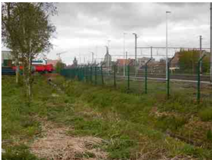
DSCN5129.JPG - Spoornummer(s): / - Inventarisnummer(s): / - Structuur: Sfeer 1 - Zone/Werkput/Kijkvenster/Vlak: ///