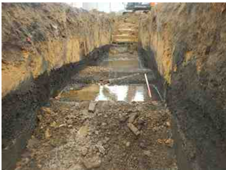
DSCN8921.JPG - Spoornummer(s): / - Inventarisnummer(s): / - Structuur: / - Zone/Werkput/Kijkvenster/Vlak: /6//