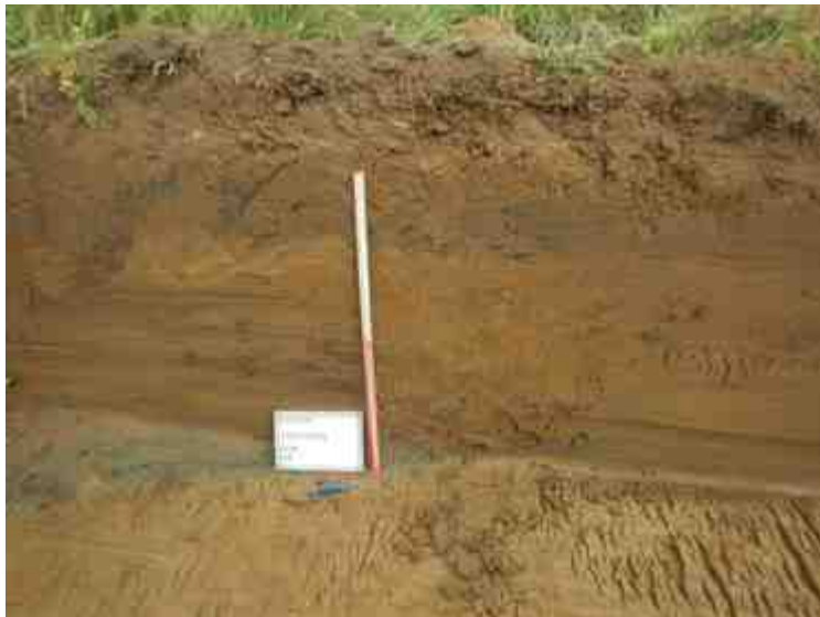
DSCN8933.JPG - Spoornummer(s): / - Inventarisnummer(s): / - Structuur: / Profiel 4 - Zone/Werkput/Kijkvenster/Vlak: /