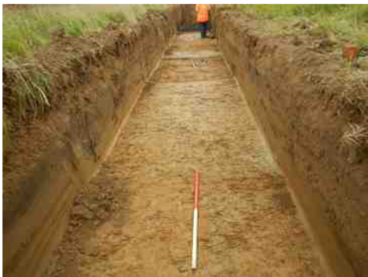
DSCN5143.JPG - Spoornummer(s): / - Inventarisnummer(s): / - Structuur: / - Zone/Werkput/Kijkvenster/Vlak: /3//