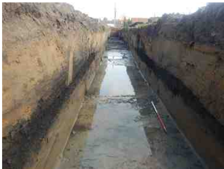
DSCN8824.JPG - Spoornummer(s): / - Inventarisnummer(s): / - Structuur: / - Zone/Werkput/Kijkvenster/Vlak: /1//