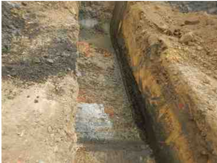
DSCN8915.JPG - Spoornummer(s): / - Inventarisnummer(s): / - Structuur: / - Zone/Werkput/Kijkvenster/Vlak: /6//