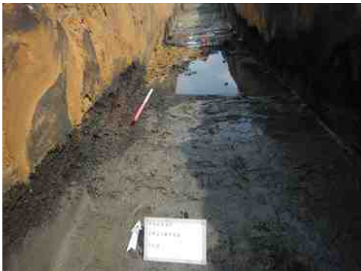
DSCN8859.JPG - Spoornummer(s): / - Inventarisnummer(s): / - Structuur: / - Zone/Werkput/Kijkvenster/Vlak: /2//