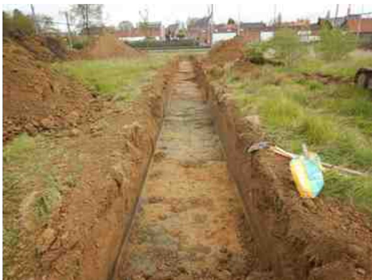
DSCN5107.JPG - Spoornummer(s): / - Inventarisnummer(s): / - Structuur: / - Zone/Werkput/Kijkvenster/Vlak: /4//