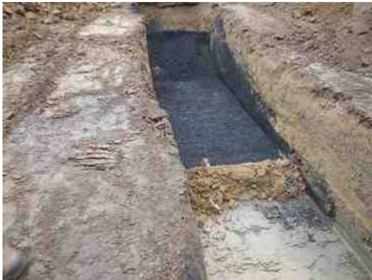
DSCN5059.JPG - Spoornummer(s): / - Inventarisnummer(s): / - Structuur: / - Zone/Werkput/Kijkvenster/Vlak: /5//