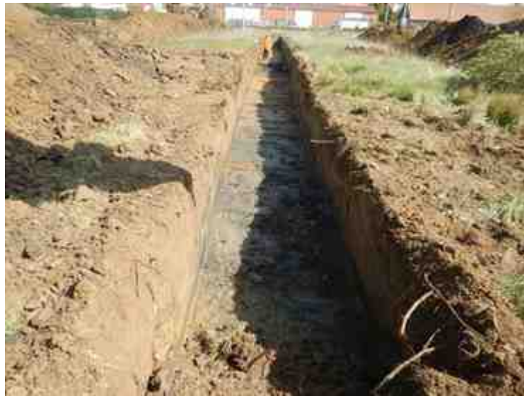
DSCN5158.JPG - Spoornummer(s): / - Inventarisnummer(s): / - Structuur: / - Zone/Werkput/Kijkvenster/Vlak: /3//