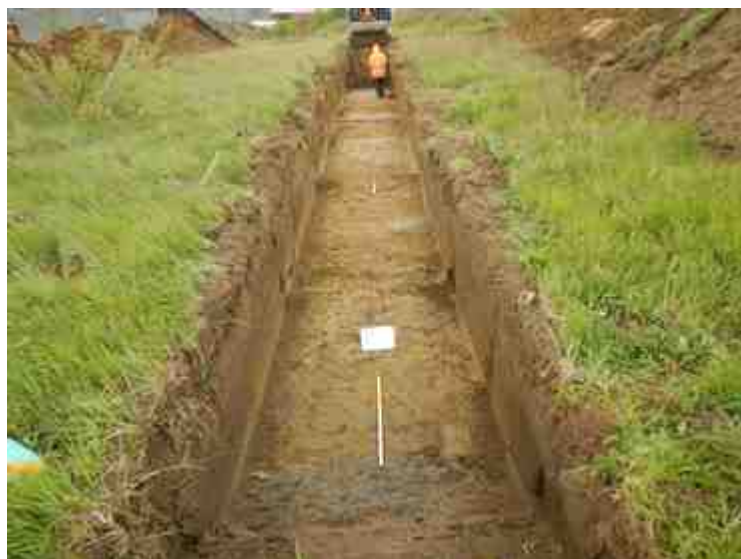
DSCN5141.JPG - Spoornummer(s): / - Inventarisnummer(s): / - Structuur: / - Zone/Werkput/Kijkvenster/Vlak: /3//