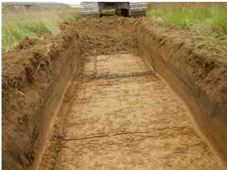
DSCN5138.JPG - Spoornummer(s): / - Inventarisnummer(s): / - Structuur: / - Zone/Werkput/Kijkvenster/Vlak: /3//