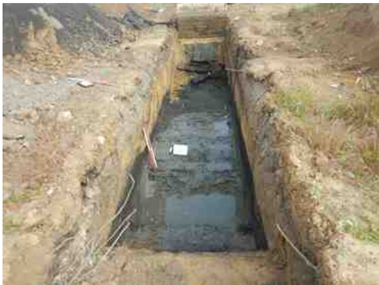
DSCN8854.JPG - Spoornummer(s): / - Inventarisnummer(s): / - Structuur: / - Zone/Werkput/Kijkvenster/Vlak: /2//