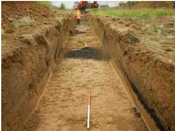
DSCN5097.JPG - Spoornummer(s): / - Inventarisnummer(s): / - Structuur: / - Zone/Werkput/Kijkvenster/Vlak: /4//