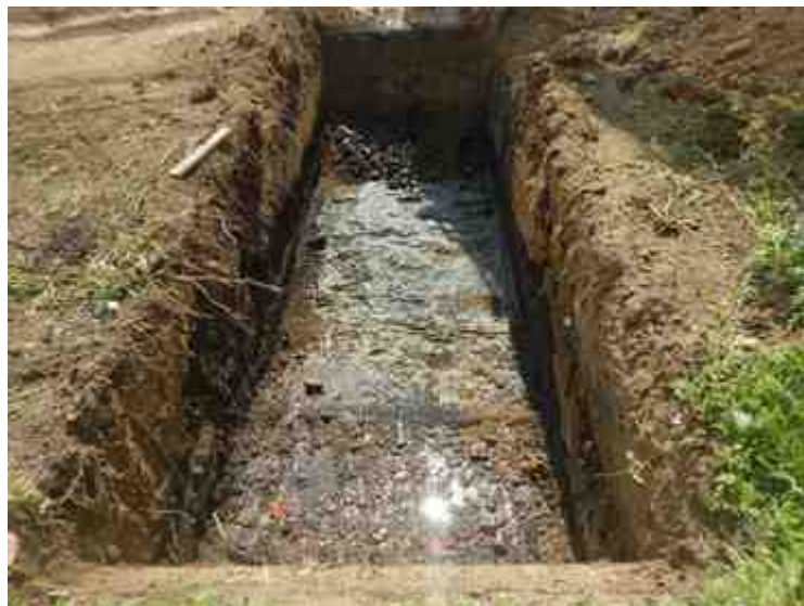
DSCN8896.JPG - Spoornummer(s): / - Inventarisnummer(s): / - Structuur: / - Zone/Werkput/Kijkvenster/Vlak: /6//