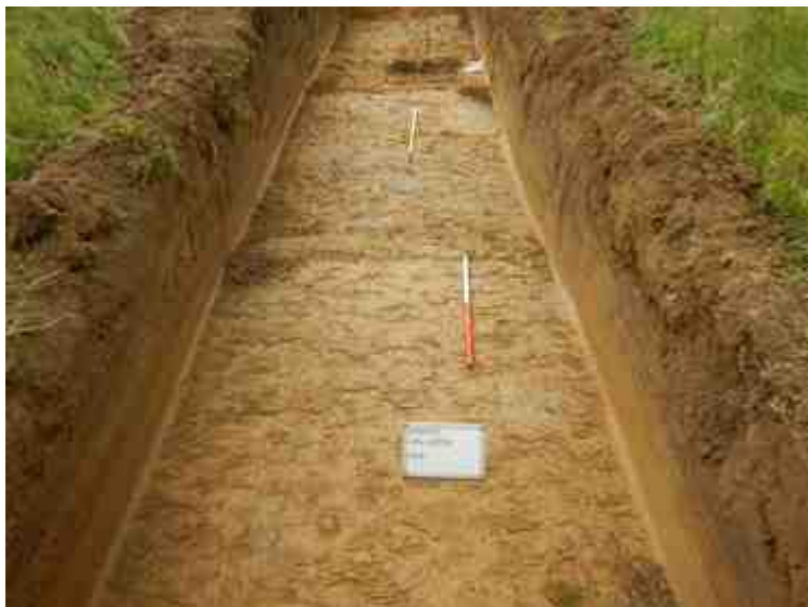
DSCN5087.JPG - Spoornummer(s): / - Inventarisnummer(s): / - Structuur: / - Zone/Werkput/Kijkvenster/Vlak: /4//