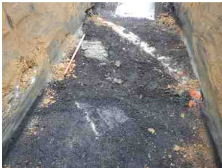
DSCN5075.JPG - Spoornummer(s): / - Inventarisnummer(s): / - Structuur: / - Zone/Werkput/Kijkvenster/Vlak: /5//