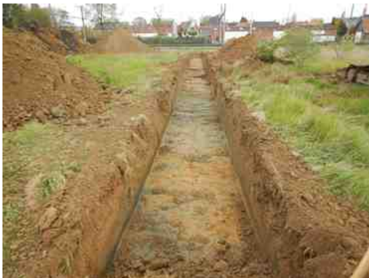
DSCN5109.JPG - Spoornummer(s): / - Inventarisnummer(s): / - Structuur: / - Zone/Werkput/Kijkvenster/Vlak: /4//