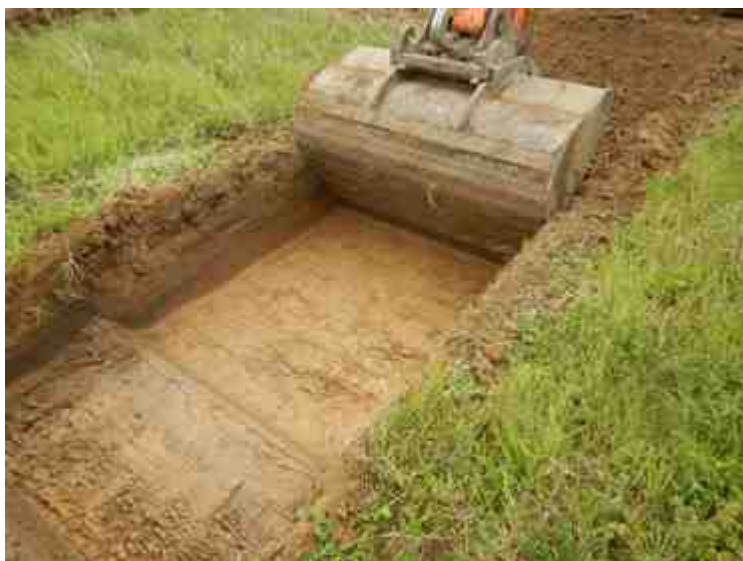
DSCN5077.JPG - Spoornummer(s): / - Inventarisnummer(s): / - Structuur: / - Zone/Werkput/Kijkvenster/Vlak: /4//