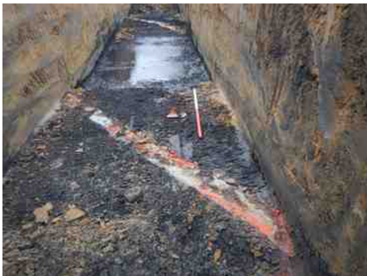
DSCN5072.JPG - Spoornummer(s): / - Inventarisnummer(s): / - Structuur: / - Zone/Werkput/Kijkvenster/Vlak: /5//