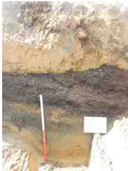
DSCN8898.JPG - Spoornummer(s): / - Inventarisnummer(s): / - Structuur: Profiel 3 - Zone/Werkput/Kijkvenster/Vlak: /