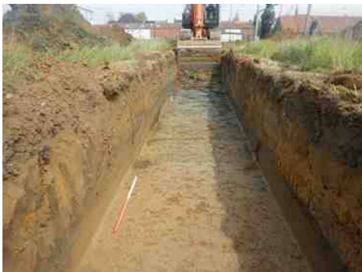
DSCN8877.JPG - Spoornummer(s): / - Inventarisnummer(s): / - Structuur: / - Zone/Werkput/Kijkvenster/Vlak: /2//