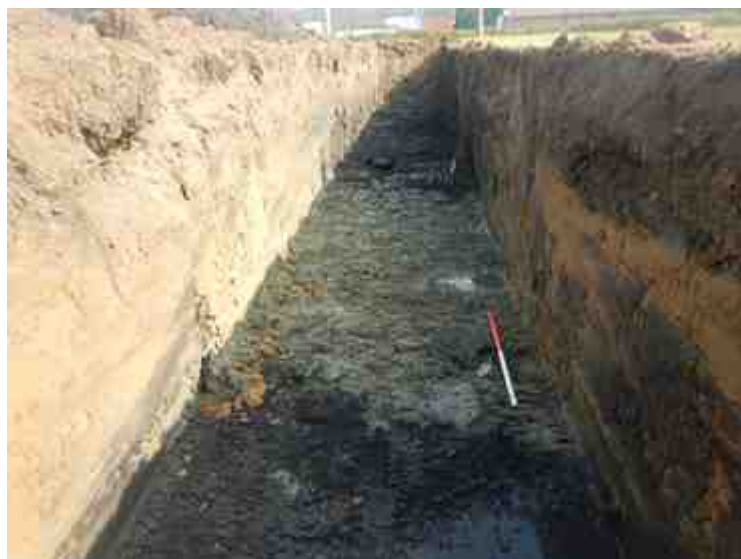
DSCN8830.JPG - Spoornummer(s): / - Inventarisnummer(s): / - Structuur: / - Zone/Werkput/Kijkvenster/Vlak: /1//