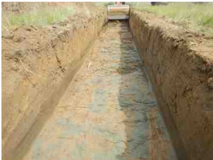
DSCN8867.JPG - Spoornummer(s): / - Inventarisnummer(s): / - Structuur: / - Zone/Werkput/Kijkvenster/Vlak: /2//