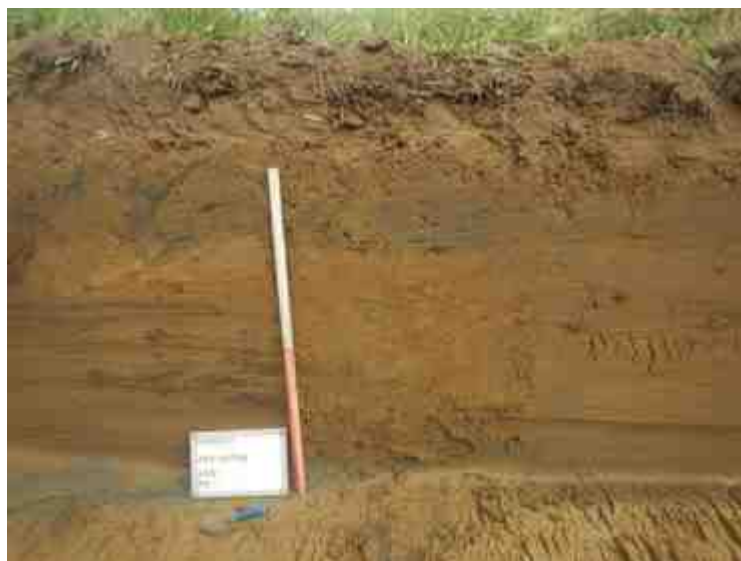
DSCN8934.JPG - Spoornummer(s): / - Inventarisnummer(s): / - Structuur: Profiel 4 - Zone/Werkput/Kijkvenster/Vlak: /