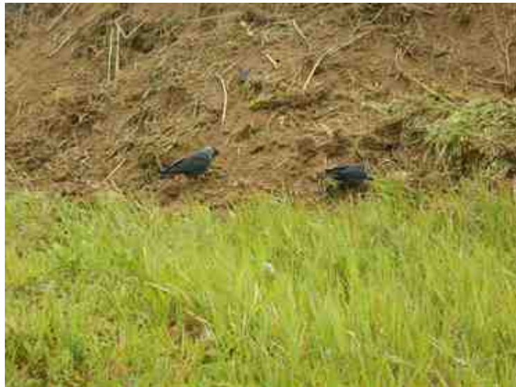
DSCN5084.JPG - Spoornummer(s): / - Inventarisnummer(s): / - Structuur: Sfeer 1 - Zone/Werkput/Kijkvenster/Vlak: /