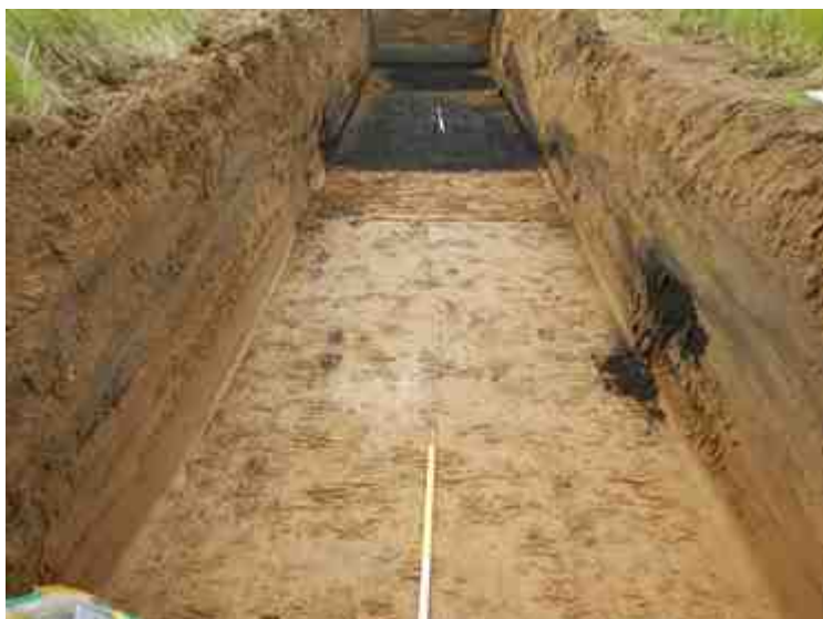
DSCN5145.JPG - Spoornummer(s): / - Inventarisnummer(s): / - Structuur: / - Zone/Werkput/Kijkvenster/Vlak: /3//