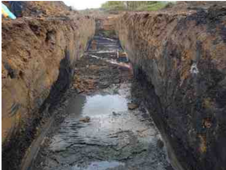
DSCN5070.JPG - Spoornummer(s): / - Inventarisnummer(s): / - Structuur: / - Zone/Werkput/Kijkvenster/Vlak: /5//