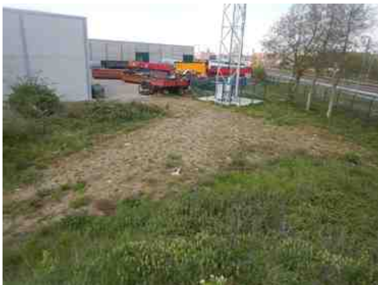
DSCN8881.JPG - Spoornummer(s): / - Inventarisnummer(s): / - Structuur: / - Zone/Werkput/Kijkvenster/Vlak: /6//